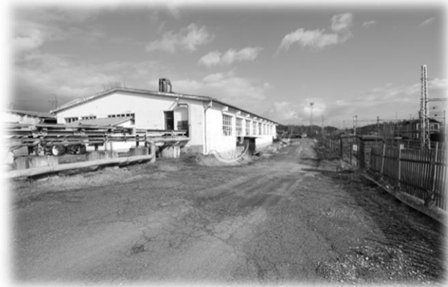
Ve Světlé rodina přečkala válku.

a po třech měsících do Světlé nad Sázavou. Zde továrna na textil nebyla a tatínek byl nucen přijmout pozici hlavního účetního na tamější pile.