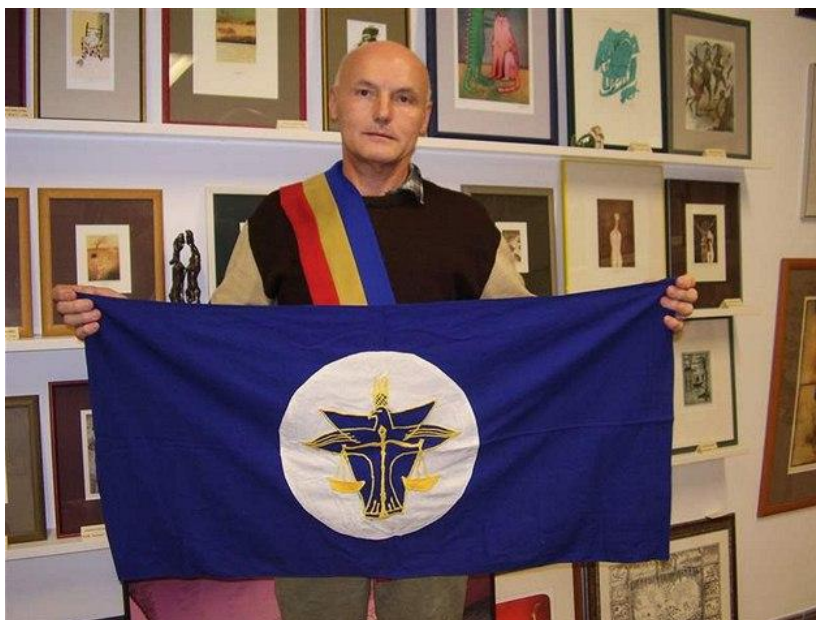
S vlajkou Hutt River a konzulskou šerpou.