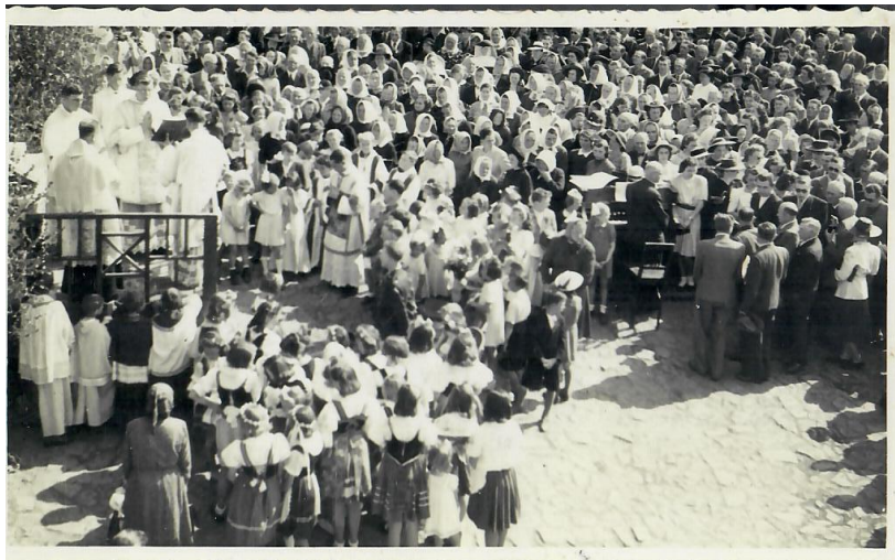
Americká mše v Nepomuku u Plzně

Po samotové revoluci paní Jiřina nastoupila na univerzitu středního věku.