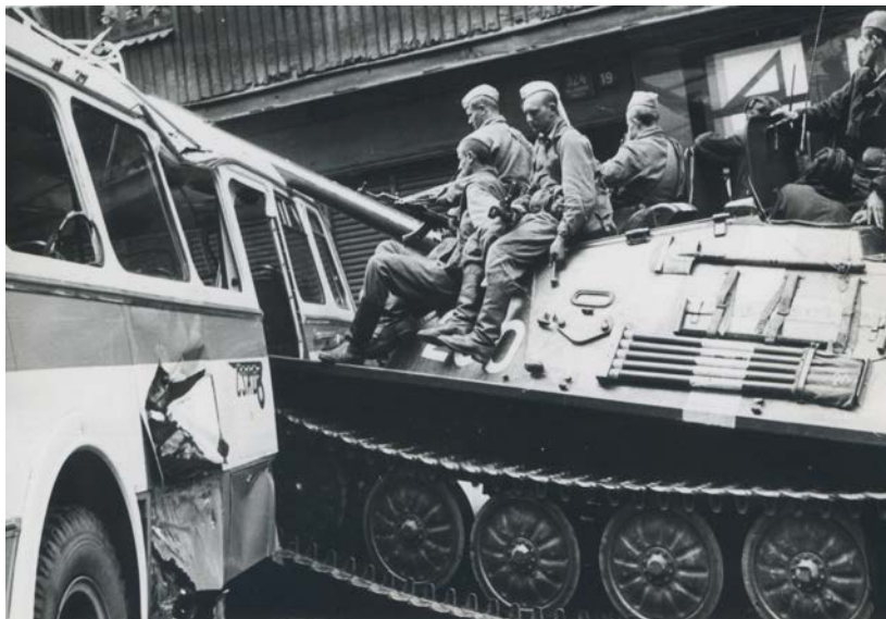
v Praze na Vinohradech srpen 1968

Uvědomoval si, že se děje něco zásadního, a chtěl být u toho. S fotoaparátem se mu podařilo projít až na Vinohradskou ulici k budově rozhlasu. Viděl, jak se sovětské tanky chtějí dostat k budově, jak lidé stavějí barikády, jak se snaží sovětským vojákům vysvětlovat, že je zde nikdo nechce. Viděl bohužel i zraněné a mrtvé. Podařilo se mu nafotit řadu snímků, které ještě toho dne v práci vyvolal, a kolem poledne se vydal znovu do pražských ulic.