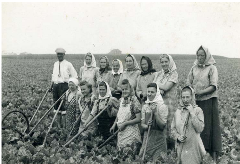
rodina a sousedé jednotí řepu