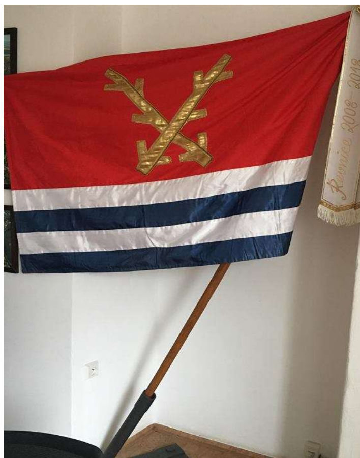
Vlajka města Řevnice