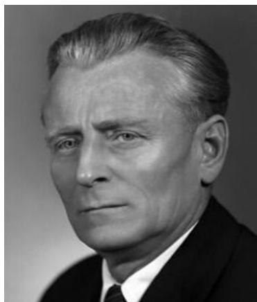
Prezident Antonín Novotný

„Rok 1968 byl pro nás takový zvláštní. Už v počátku prezident Novotný říkal, že to bude velmi dobrý rok. Byla vyhlášena velká amnestie, která se týkala i těch, co jsou v zahraničí. Tady bych chtěl pak poukázat na to, že náš příbuzný, o kterém chci mluvit, v zahraničí byl. Odešel do zahraničí v roce 1948, poté co ho vyhodili z VŠ zemědělské, aby si školu někde dostudoval. Krátce byl v Německu a později se dostal až do Austrálie.“