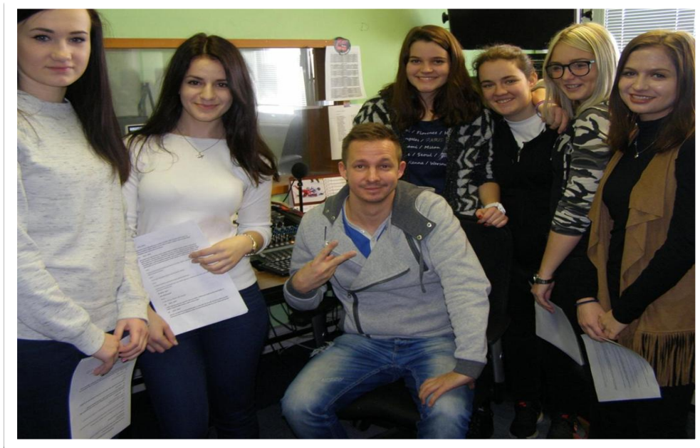
Naše návštěva v Signál rádiu v Mladé Boleslavi při nahrávání reportáže