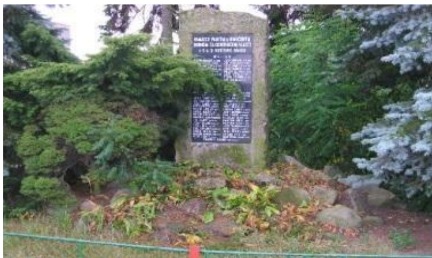
Pomník v obci Ledce na památku 34 občanů, kteří padli v boji