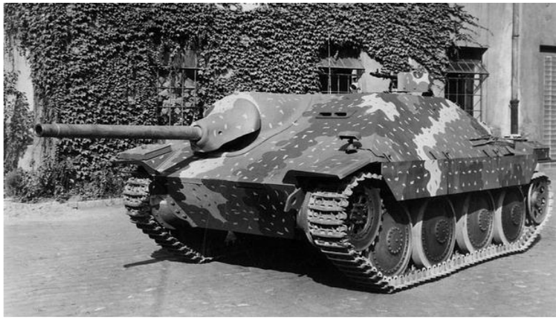
Tank Hetzer, který doprovázel rotu německých vojáků v obci Ledce