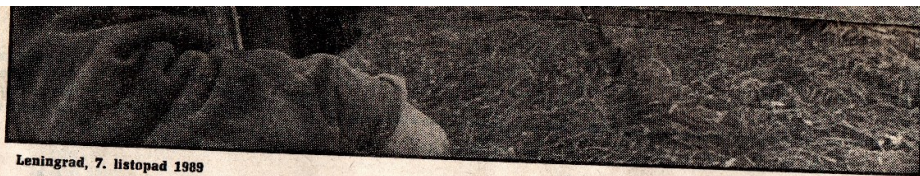
Leningrad, 7. listopad 1989