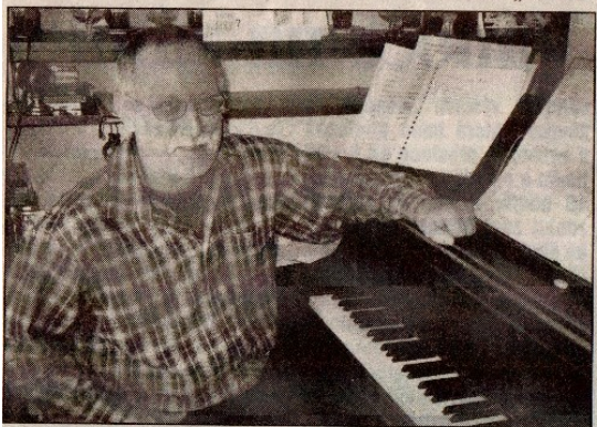
Edvard Schiffauer u svého klavíru. Zde se podle jeho slov dlouze a těžce rodí jeho skladby.

JAMU a začal učit na Janáčko- vě konzervatoři v Ostravě. „Učím hrozně rád,“ podotýká skladatel, který je znám v čes- kých i zahraničních hudebních kruzích. V roce 1999 byl prestižní Mezinárodní společností pro soudobou hudbu vybrán k provedení jeho smyčcový kvartet Vzpětí jako první čes- ké hudební dílo po devíti letech.