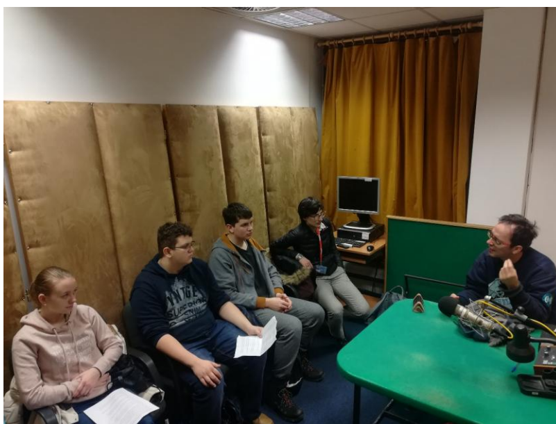
Natáčení ve studiu Českého rozhlasu

„A já jsem říkala tomu vyšetřovateli: Zabte mě třeba, podepsat nikdy v životě, já nejsem v žádný straně nikdy nebudu, a abych vám podepsala takovýhle svinstvo? Já chci bejt čistá, až se vrátím a každému se podívat do očí.“