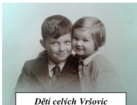
Děti celých Vršovic