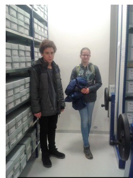
V Archivu bezpečnostních složek

Naší další exkurzí byla návštěva Archivu bezpečnostních složek. Nejdříve jsme se ocitli v kůži archiváře a vyšetřovali jsme případ na základě dostupných výpovědí a fotografií. Poté jsme šli na prohlídku archivu, kde jsme například viděli, jak se restaurují různé dokumenty a listiny. Potom nás zavedli do místnosti s archiváliemi v posuvných regálech, se kterými jsme si mohli vyzkoušet pohybovat. Ještě předtím jsme se dozvěděli mnoho informací z přednášky, především z období socialismu.