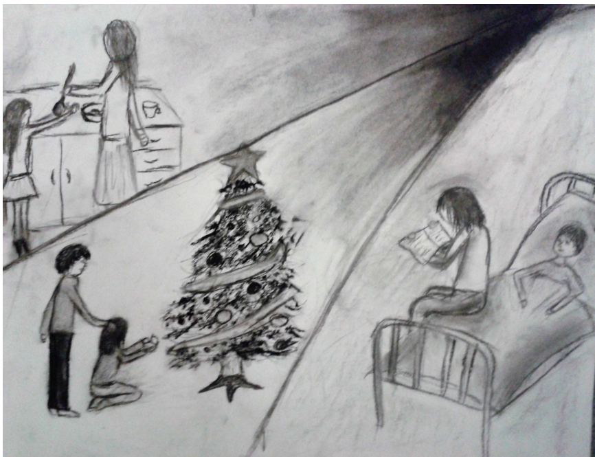
Od Daniely Tejnecké