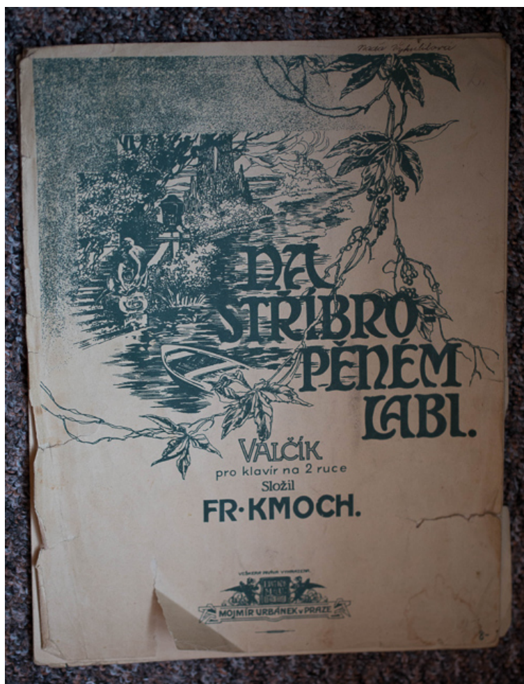
Skladba, kterou nám hrála při nahrávání