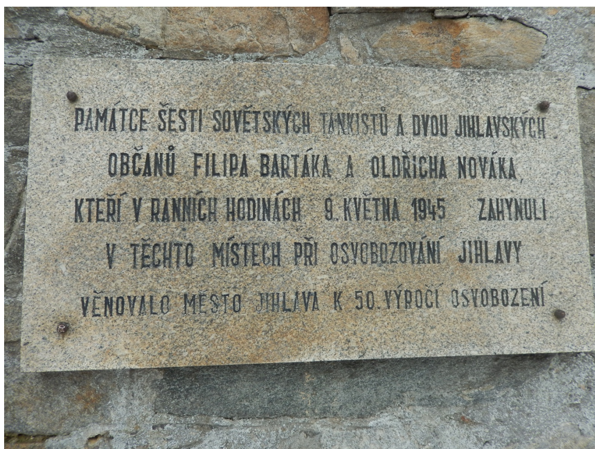
Výše popisovanou událost připomíná pamětní deska u ústředního hřbitova v Jihlavě