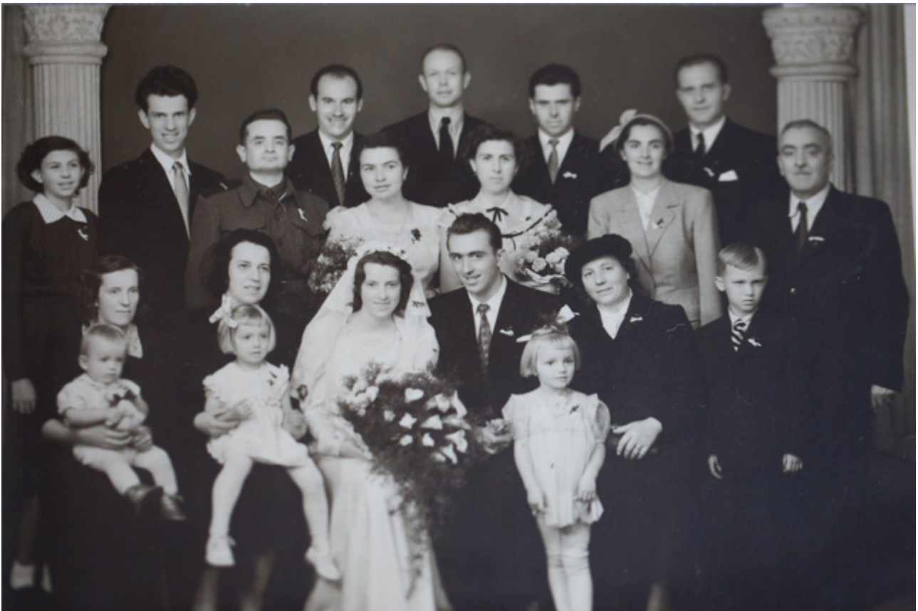
Svatební fotografie celé rodiny 1953