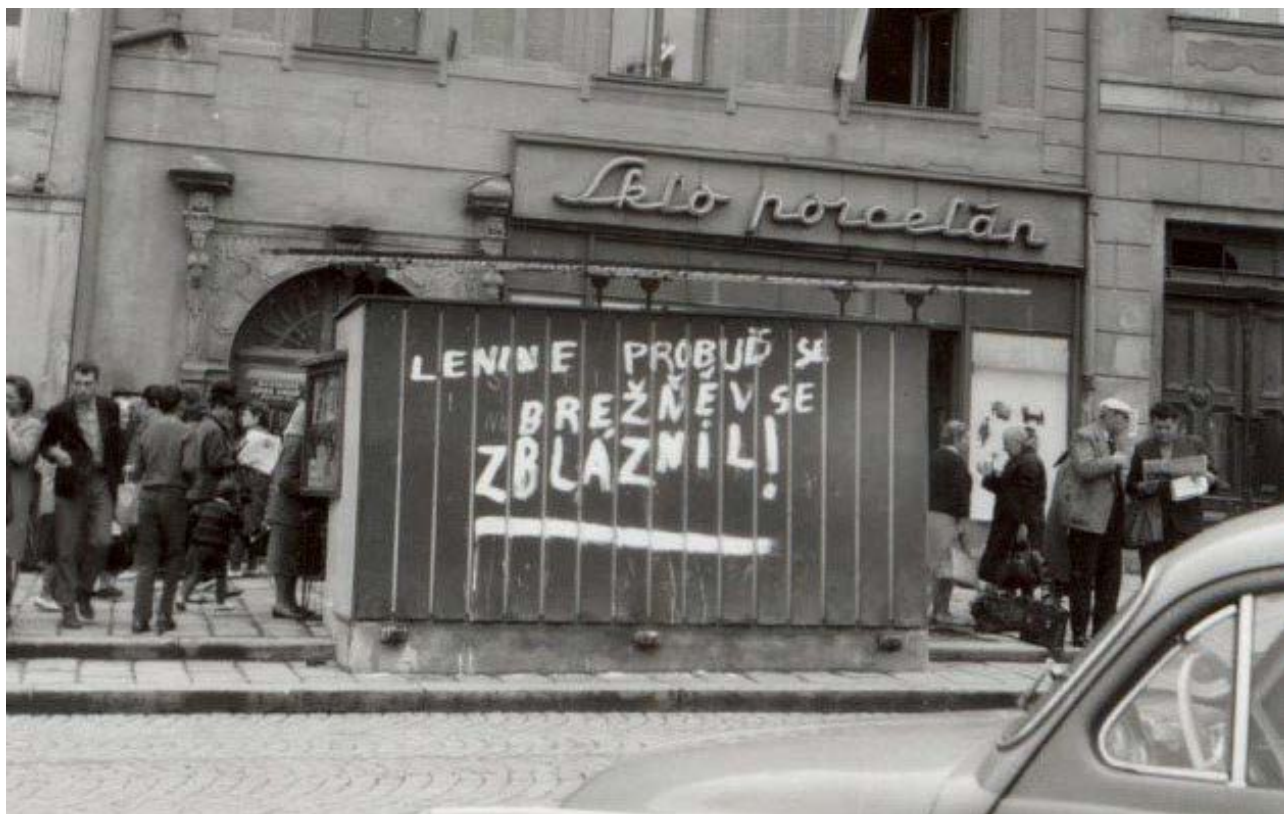
Srpen 1968 v Jihlavě 3)