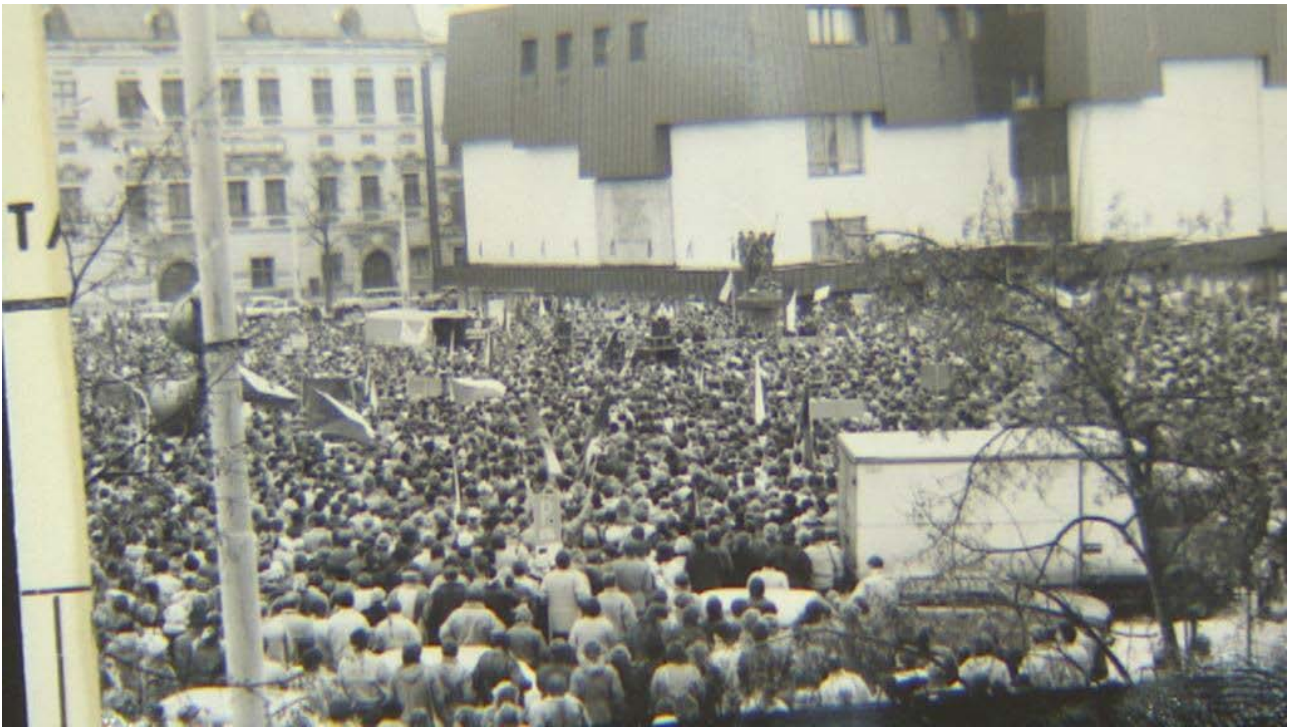
Dav lidí na Masarykově náměstí - listopad 1989 4)