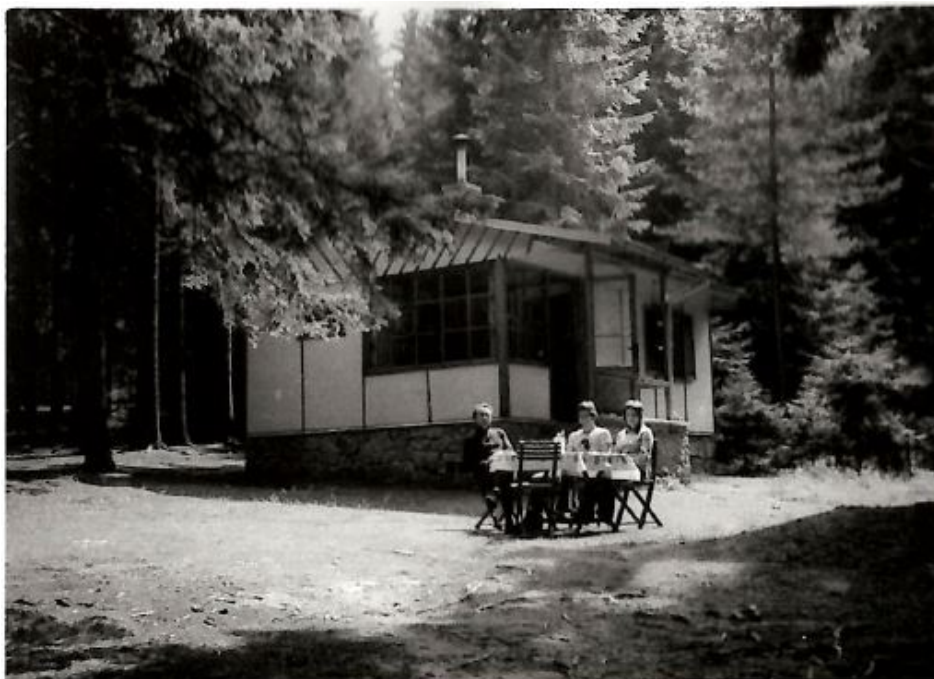
Chata na Okrouhlíku

60. léta prožívala rodina poklidně. V roce 1967 si postavili chatu na Okrouhlíku a v roce 1966 zakoupili zánovní automobil. O důvodech, proč ho koupili, vypráví: