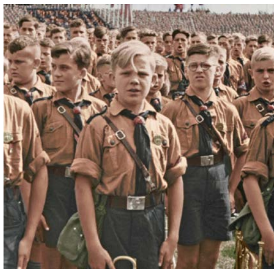
Ilustrační fotografie Hitlerjugend 1)

Jaký měla strach po cestě na hodinu klavíru, líčí takto: