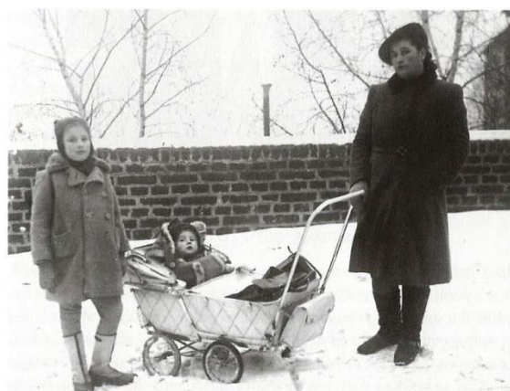
Obr.1 S maminkou a bratrem