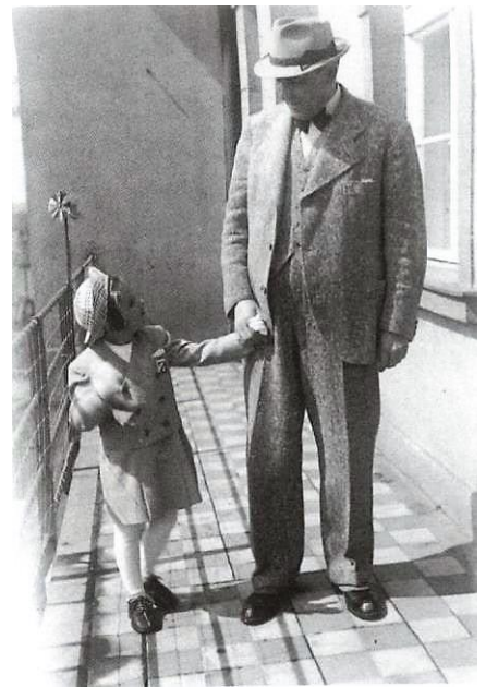
Obr. 2. S tatínkem

Marta: Ve 13 letech ji zemřel tatínek a tím se život celé rodiny změnil. Bylo to o to těžší, že byl rok 1948. Během studia zažila školskou reformu