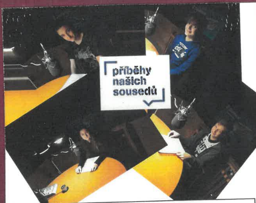
Vytvořili: Vend'a Havlíčková, Lucka Rosípalová, Petr Kleibl a Lukáš Bittner