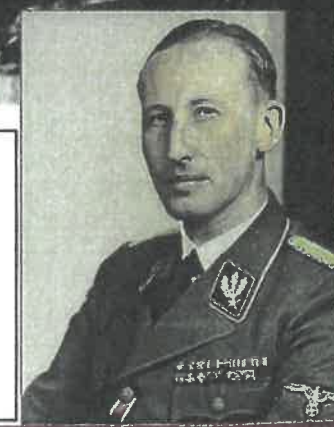
27. květen 1942 Den atentátu na Reinharda Heydricha, zastupujícího říšského protektora