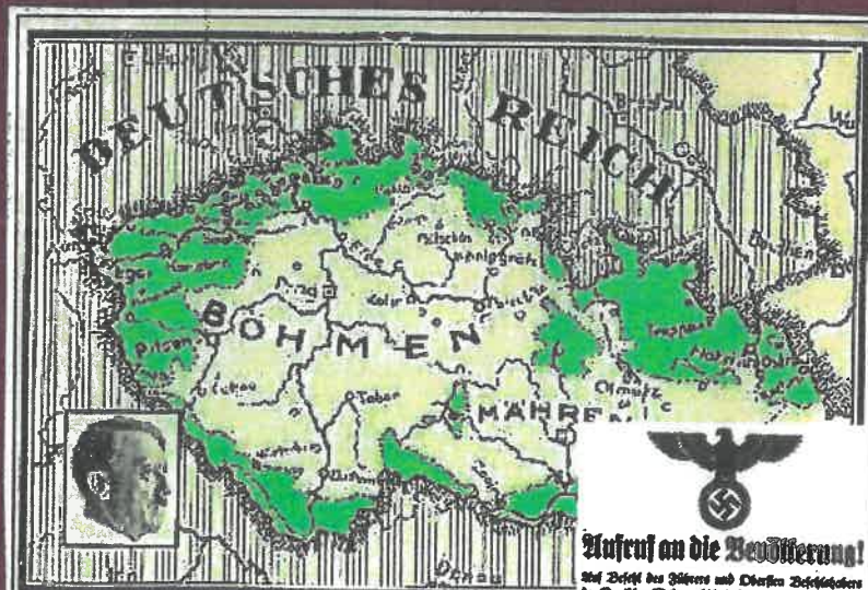
15. březen 1939 Den vzniku Protektorátu Čechy a Morava Konec samostatné ČSR