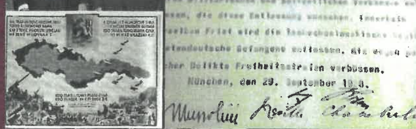
30. září 1938 Den mnichovské zrady – odtržení Sudet