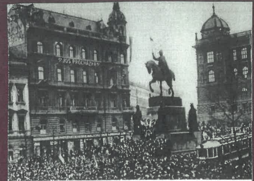
28. říjen 1918 Den vzniku samostatné Československé republiky