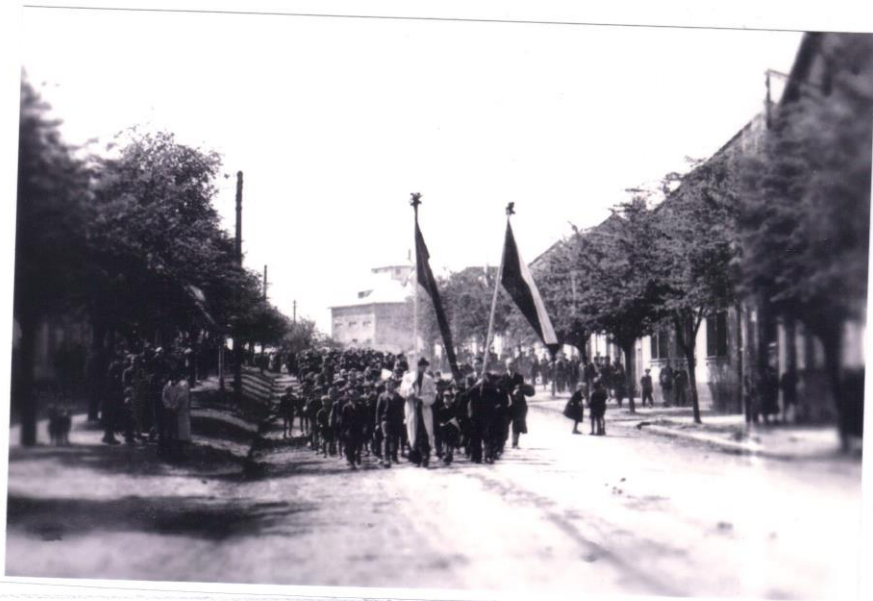
Průvod napajedelských občanů