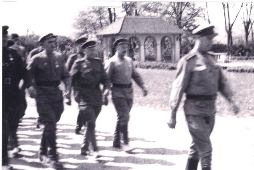
Delegace Rudé armády