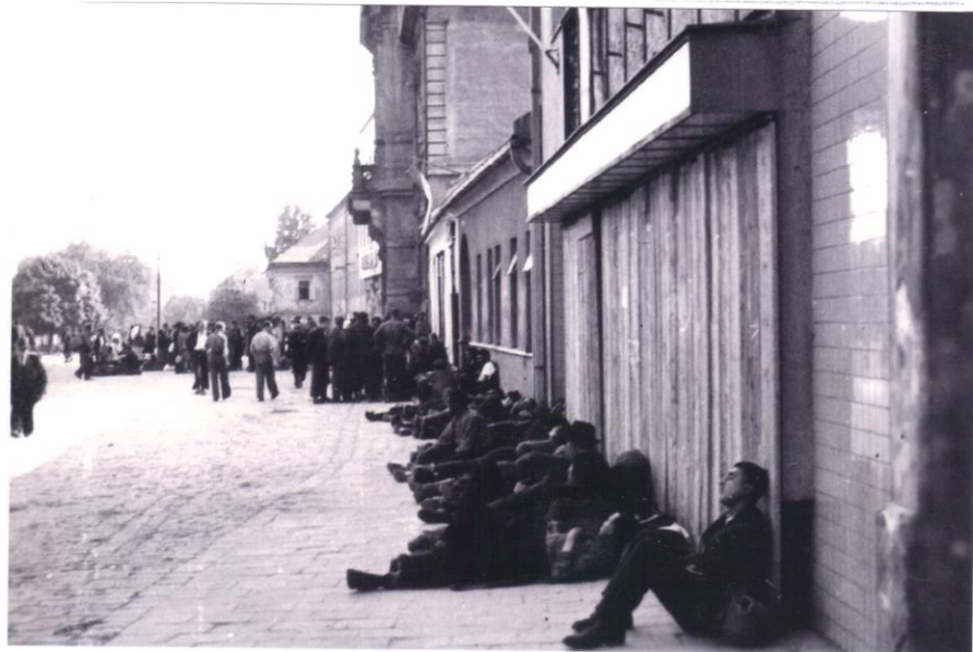
Přes Napajedla se vraceli muži z totálního nasazení v Německu, případně z koncentračních táborů.