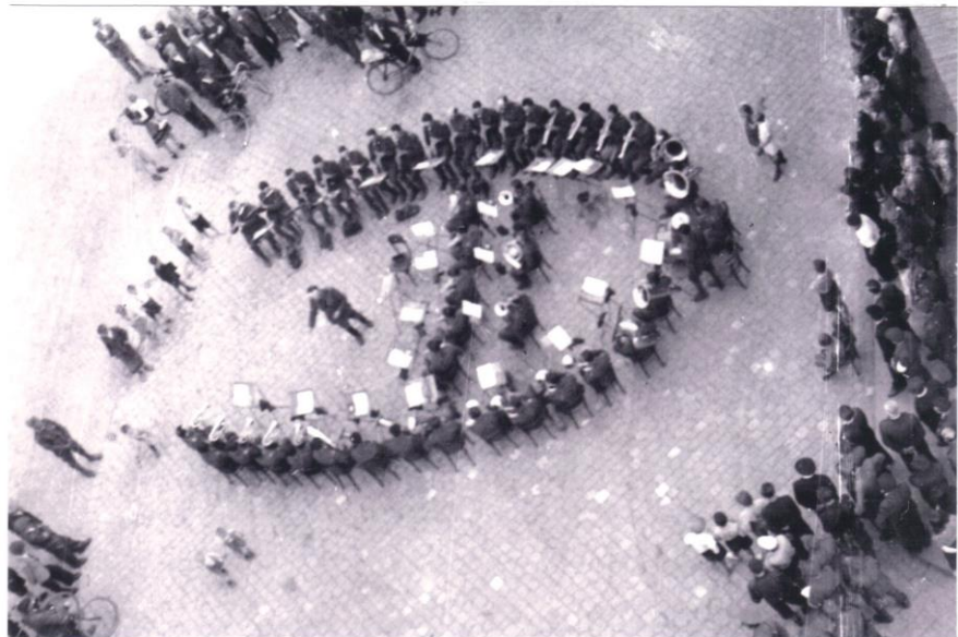
Hudba Rumunské armády