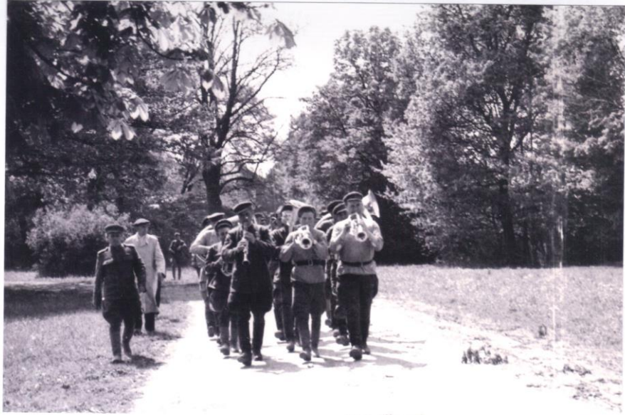
Hudba Rudé armády