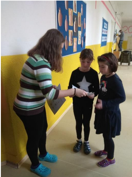
Žákyně plní úkoly