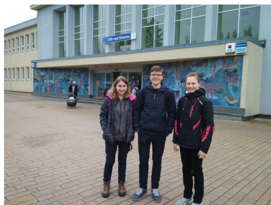
Před vlakovým nádražím ve Žďáru nad Sázavou.