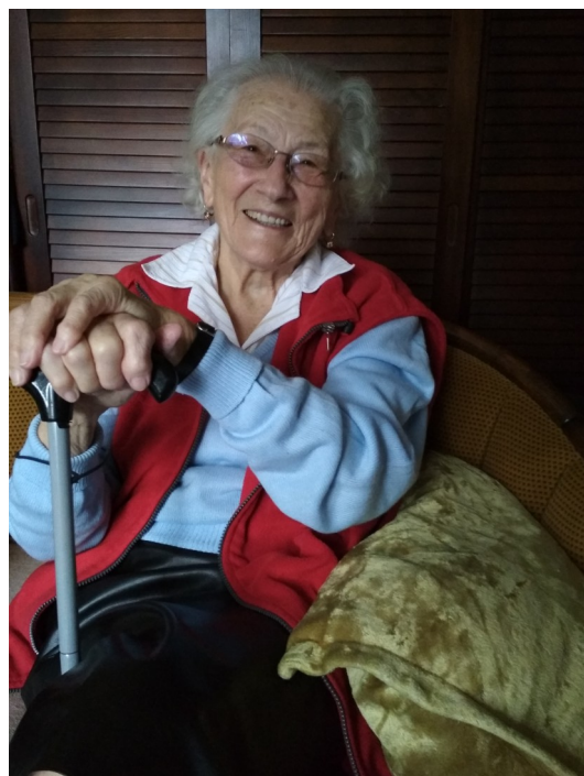
Životní motto paní Doležalové zní: „Co musíš, jako bys rád...“