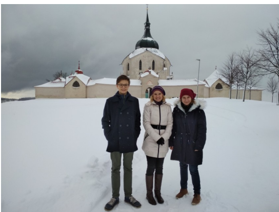
Poutní místo Zelená hora ve Žďáru nad Sázavou