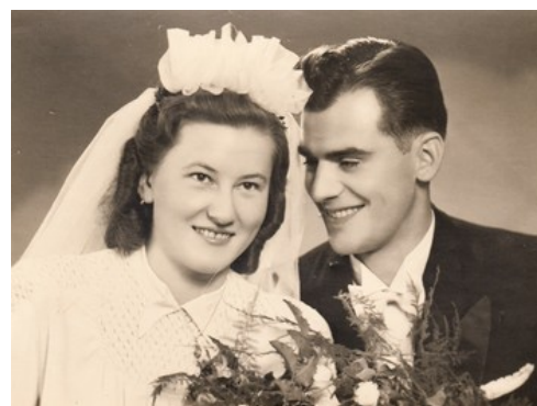
Svatební fotografie z roku 1943.