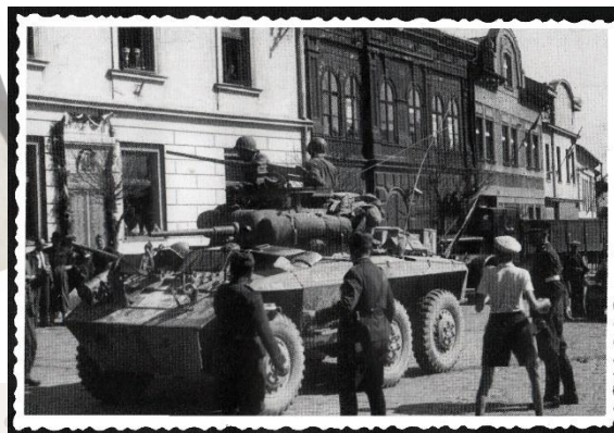
Americký transportér před mirovicickou radnicí - 10. 5. 1945