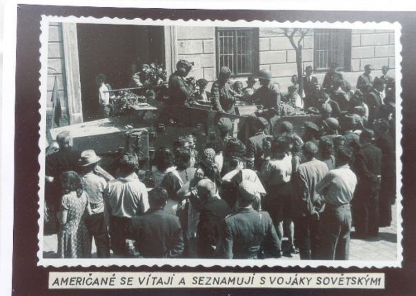
AMERIČANÉ SE VÍTAJÍ A SEZNAMUJÍ S VOJÁKY SOVĚTSKÝMI