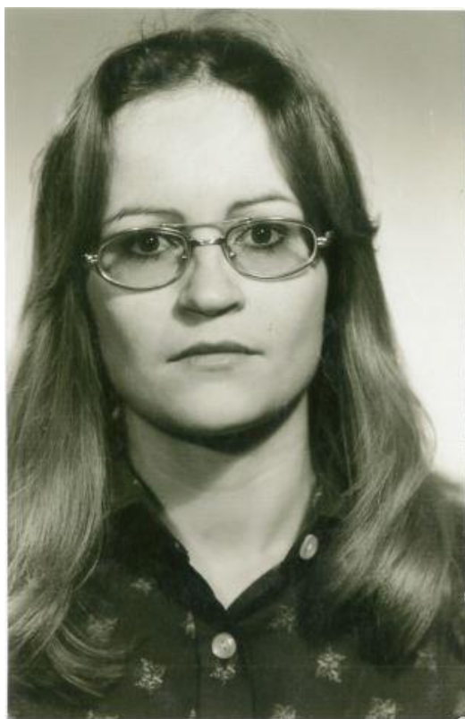
Fotka paní Strážnické z roku 1976, kdy maturovala.

Pan ředitel si mě zavolal. Šli jsme tam každý sám, abychom asi byli beze svědků, nevím, jak to bylo tehdy koncipované, a řekl mi, jestli se nechci vdát. A já jsem řikala: „Ne, mně je osmnáct, já chci studovat.“ – „No, tak prostě ty studovat nebudeš! Ty studovat nemůžeš, protože nejsme přesvědčeni, že nejsi vychována v duchu revizionismu, oportunismu...“ V té době mi tyhle termíny byly celkem neznámé, nebo jsem si až tak pod tím nedokázala vysvětlit proč, co jsem tedy provedla.