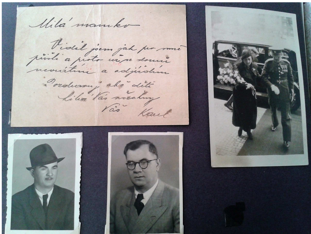
Přeměna tatínka, aby ho nacisté nepoznali.