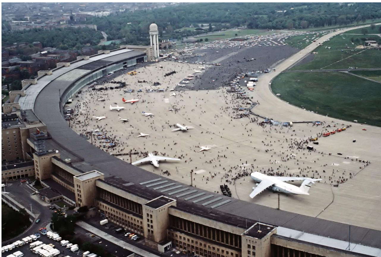
(letišťe Berlin – Tempelhof [2])

Tou dobou bylo asi devět hodin ráno, celý den byl před ním. Na procházku byla zima, tak si koupil celodenní jízdenku na S-Bahn, který jezdil kolem Berlína. Za ten den objel třikrát celé město. V západní části nebyly žádné hlídky, ale ve východní se to jimi jen hemžilo. Byl si vědom rizika kontroly, a když se objevil na západní hranici a viděl, že nikde nejsou hlídky, vždy se mu ulevilo. Kdyby ho zkontrolovali a vzali na stanici, mohl by zmeškat letadlo. To by byl problém.