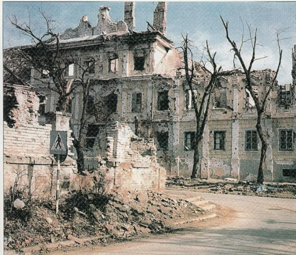
Razrušení dvorac Eltz postao je simbolom srpskoga "barbarogenija" na kraju 20. stoljeća

Radost ze svobody po roce 1989 panu Zdražilovi zkalily válečné události v tehdejší Jugoslávii, které velmi pečlivě sledoval