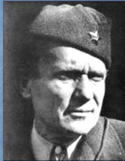
Josep Broz Tito (1892-1980)

Josep Broz Tito byl jugoslávský komunistický politik, dříve partyzán a později prezident (1953-1980). Tito byl jedním z organizátorů jugoslávského odporu proti německé a italské okupaci během druhé světové války. Účastnil se partyzánských bojů, byl partyzánským velitelem a získal si značnou popularitu mezi obyvateli těžce zkoušeného státu. V roce 1945 obnovil Jugoslávii jako komunistický federativní stát. Sám působil jako sjednocující osobnost mezi všemi národy země, hlavně mezi Chorvaty a Srby. Za jeho vlády SFRJ prosperovala, došlo k rozvoji průmyslu i vzestupu životní úrovně, zároveň však vzhledem k postavení chudých členů federace, jakými byla Bosna a Hercegovina a Makedonie, došlo k zasetí nenávisti trávající dodnes. Po Titovi bylo pojmenováno i město – mezi lety 1946 a 1992 nesla Podgorica v Černé Hoře název Titograd. Mnozí lidé ze starší generace stále vzpomínají v nástupnických státech Jugoslávie na Tita pozitivně.