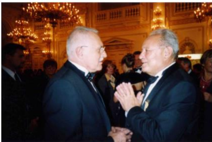
na Hradě s prezidentem Klausem