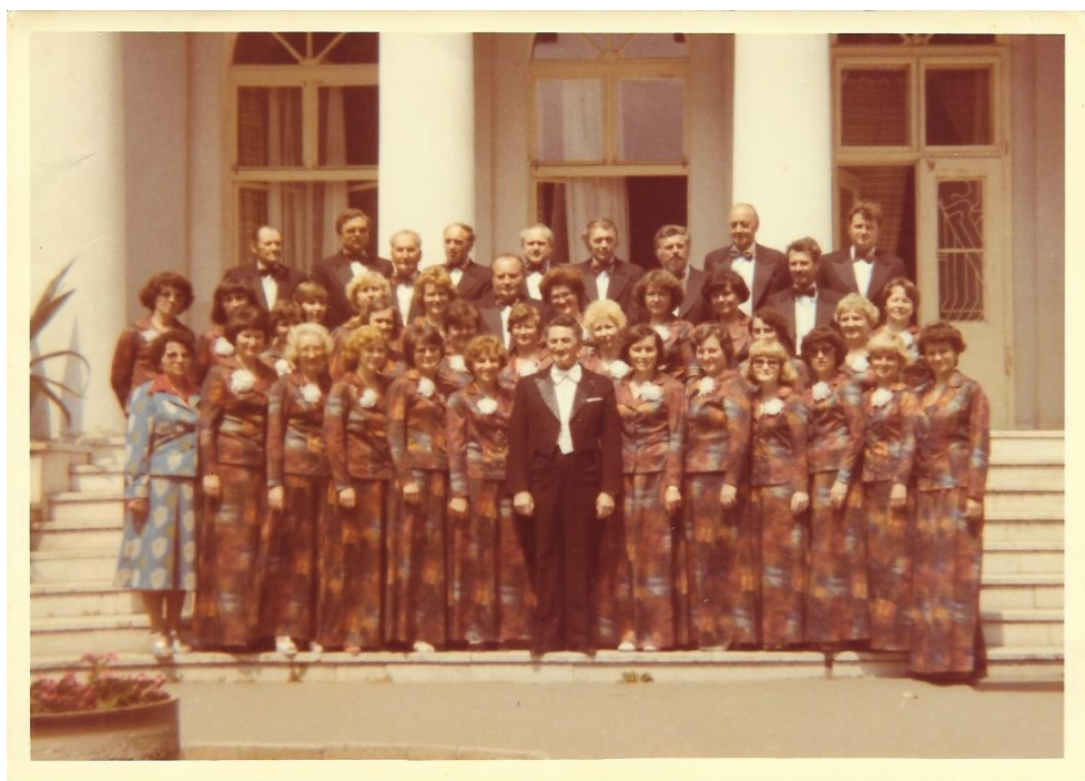
A se sborem Cantilena – v první řadě vlevo vedle dirigenta (zpívala první alt)