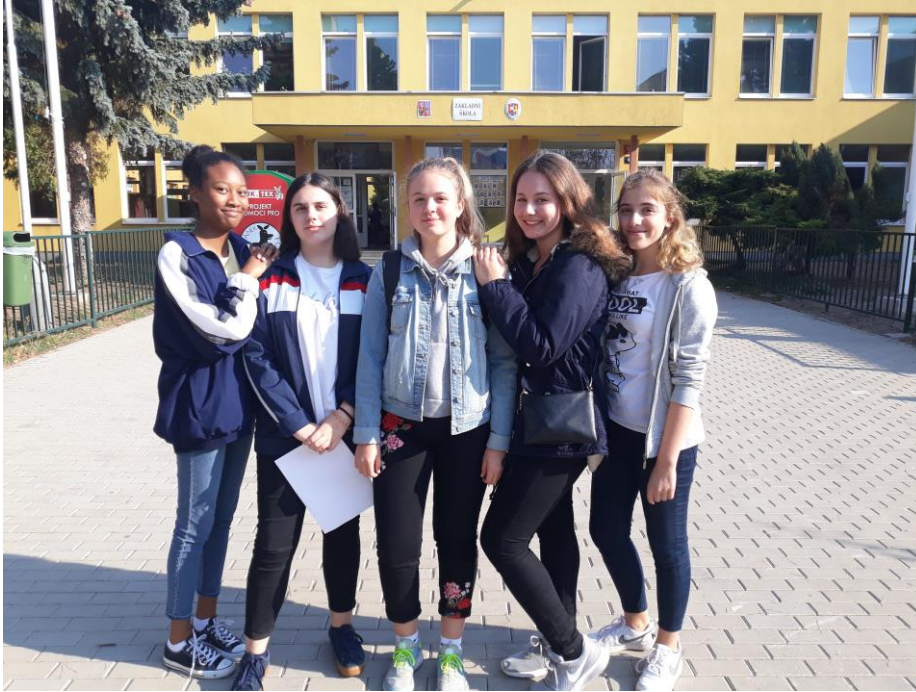
To jsme my – tým Základní školy Glowackého