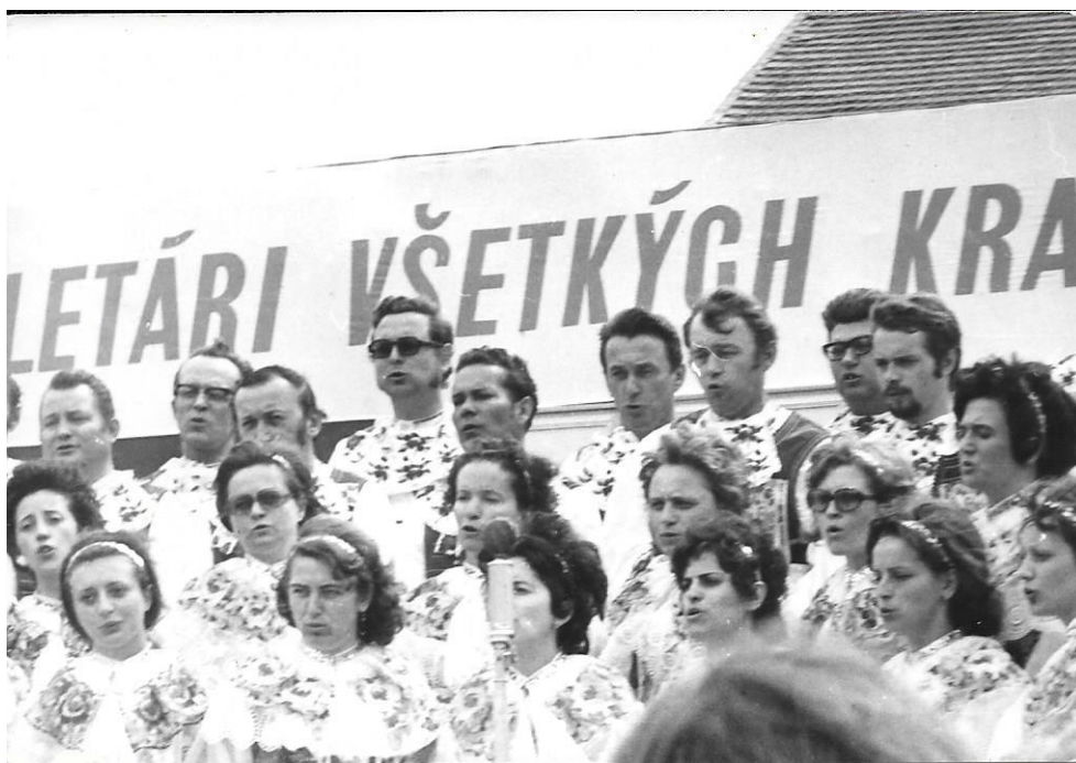
Její největší láskou byl zpěv – folklórní soubor ve Slavičíně (v první řadě druhá zleva)