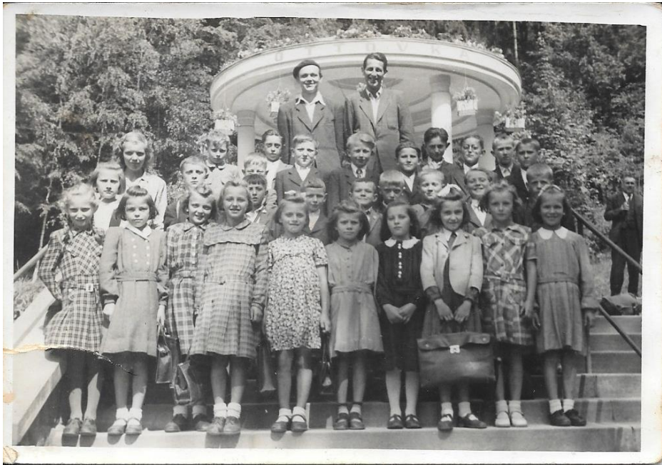
A se spolužáky z bohuslavické školy