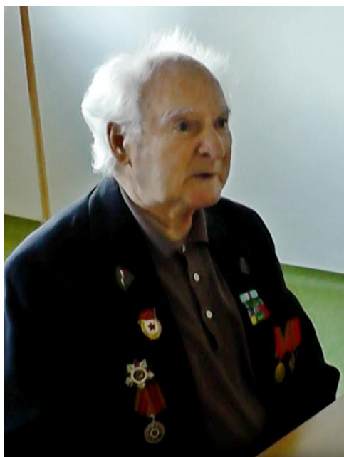
2019 na besedě v ZŠ Moravská Nová Ves

Na válku nevzpomínám rád, z traumat, která jsem utrpěl, jsem se musel léčit. Lékařka mi poradila: „Dělejte si ze všeho srandu.“ Toho se držím, jen musím dávat pozor, abych nikoho neurazil.