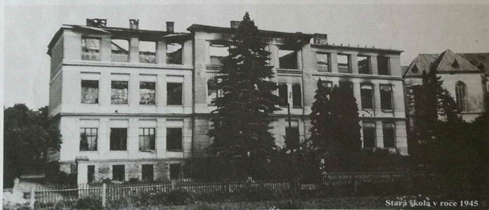
Stará škola v roce 1945