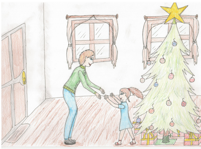
šťastný návrat matky ze Svatobořic