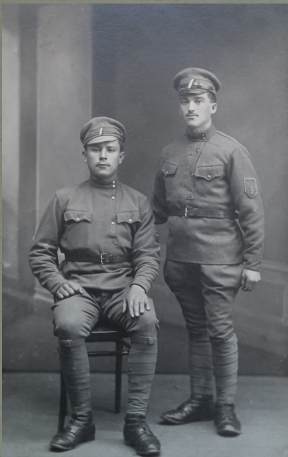
Vladivostok Rusko 1918