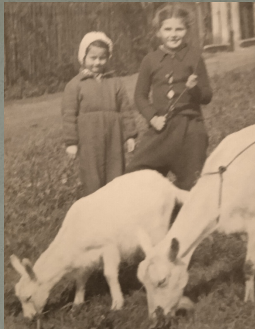
S kamarádkou v ulici pase kozy.