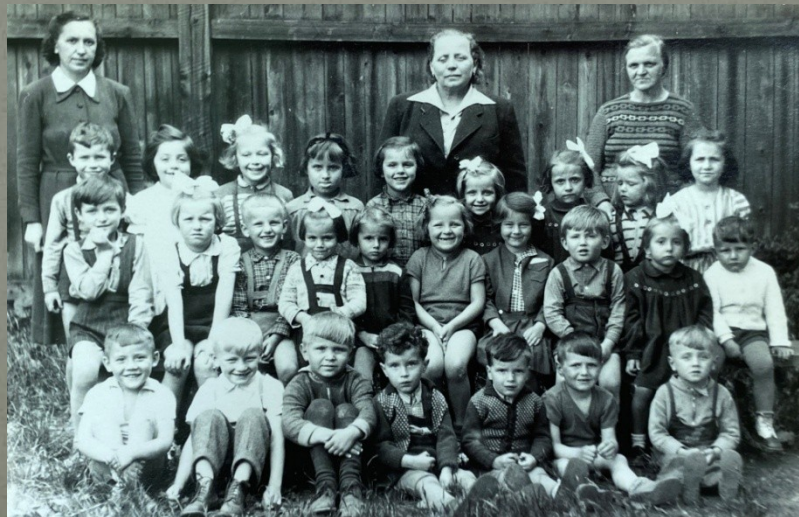
Ve školce roku 1953 - 1954