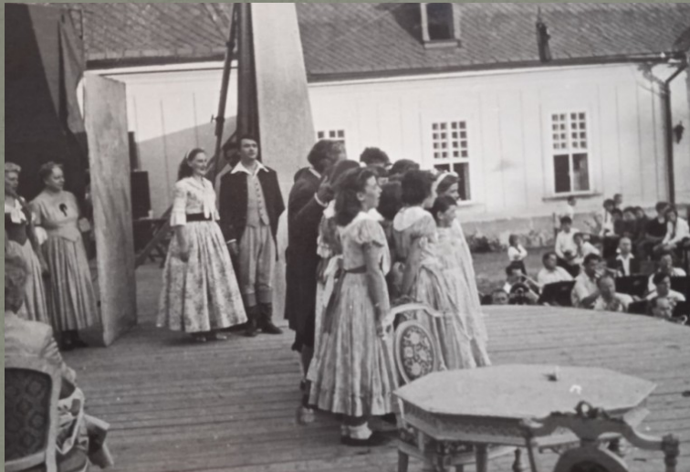
Jakobín (A. Dvořák)