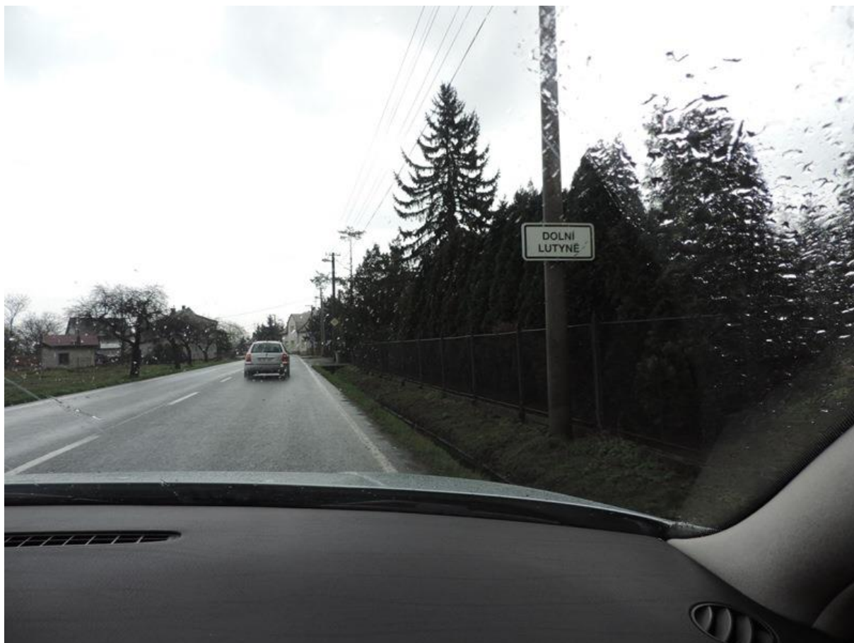
Cesta do Dolní Lutyně