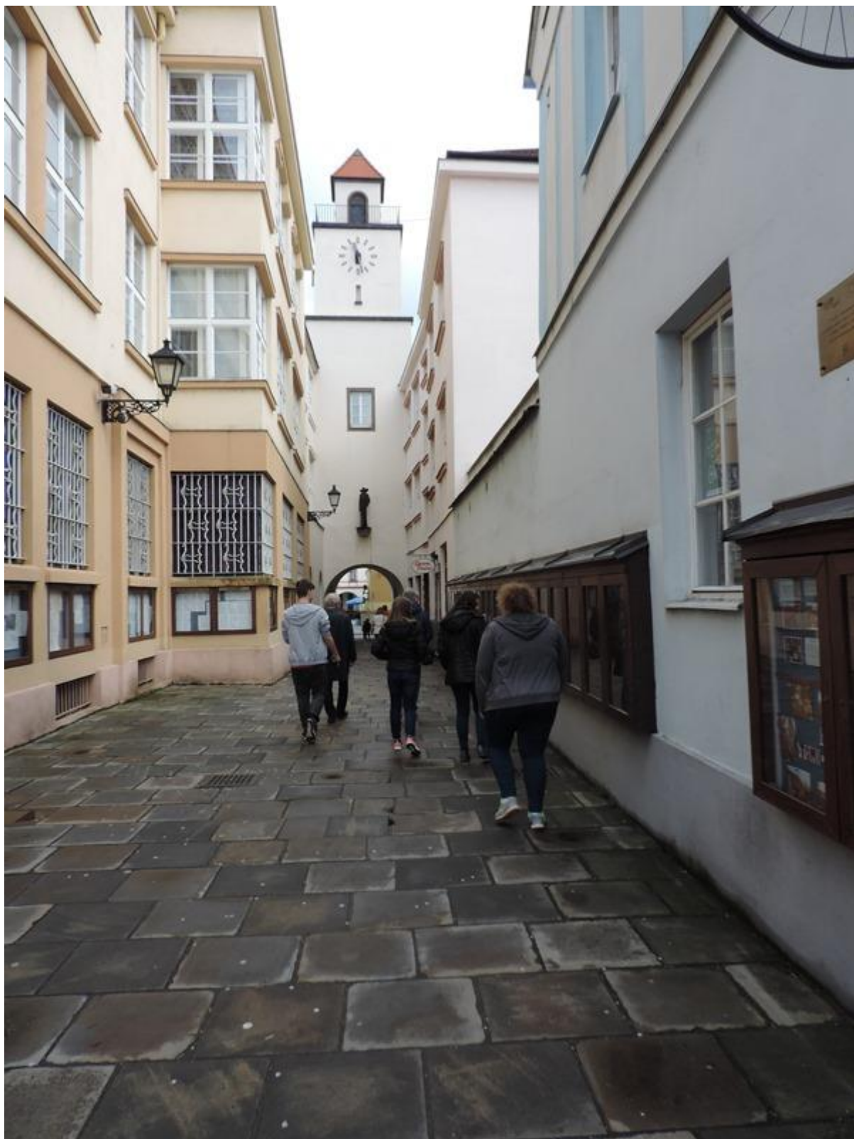
Nový Jičín – procházka městem