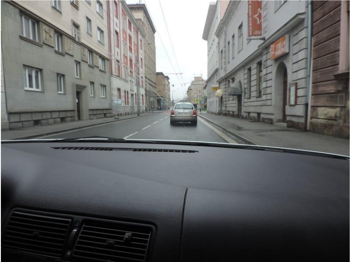
Cesta na radnici