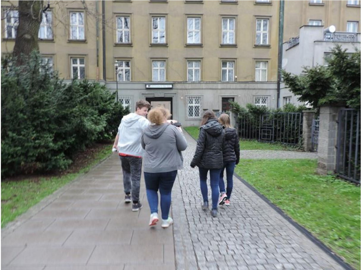
Cesta na radnici