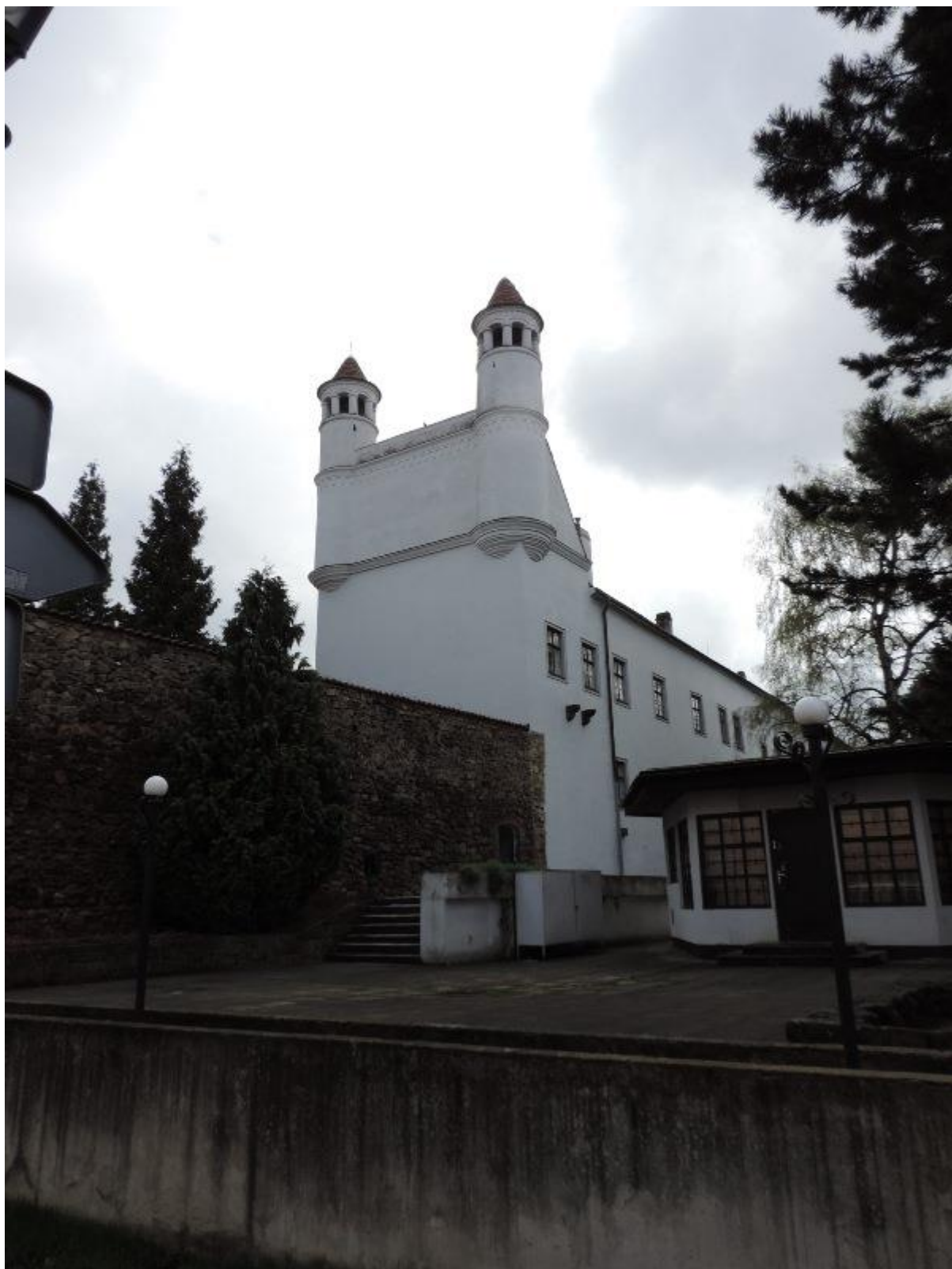
Nový Jičín - zámek