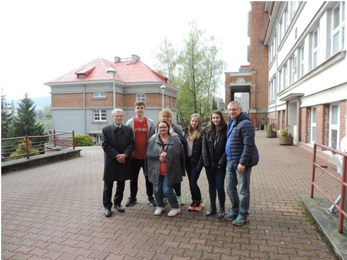
Gymnázium Nový Jičín – společná fotografie s rodiči