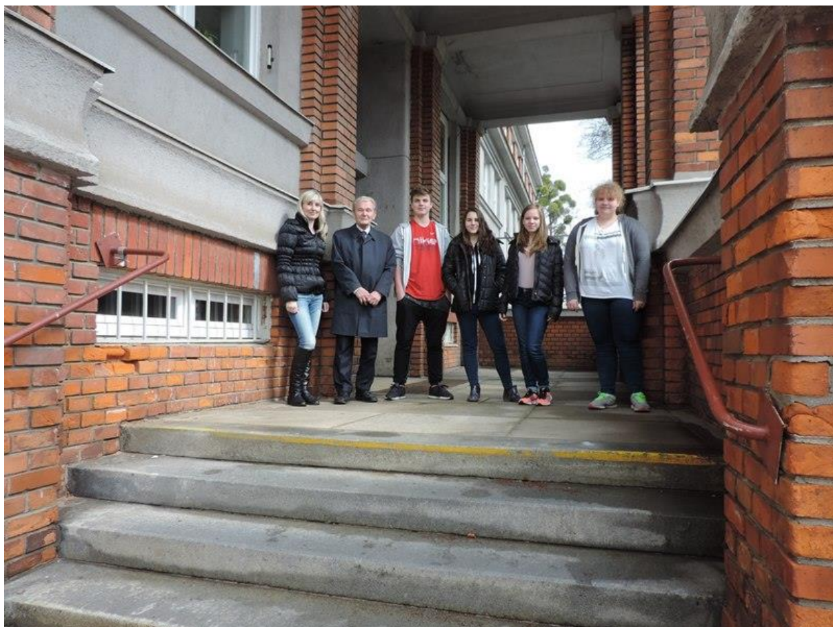
Gymnázium Nový Jičín – společná fotografie