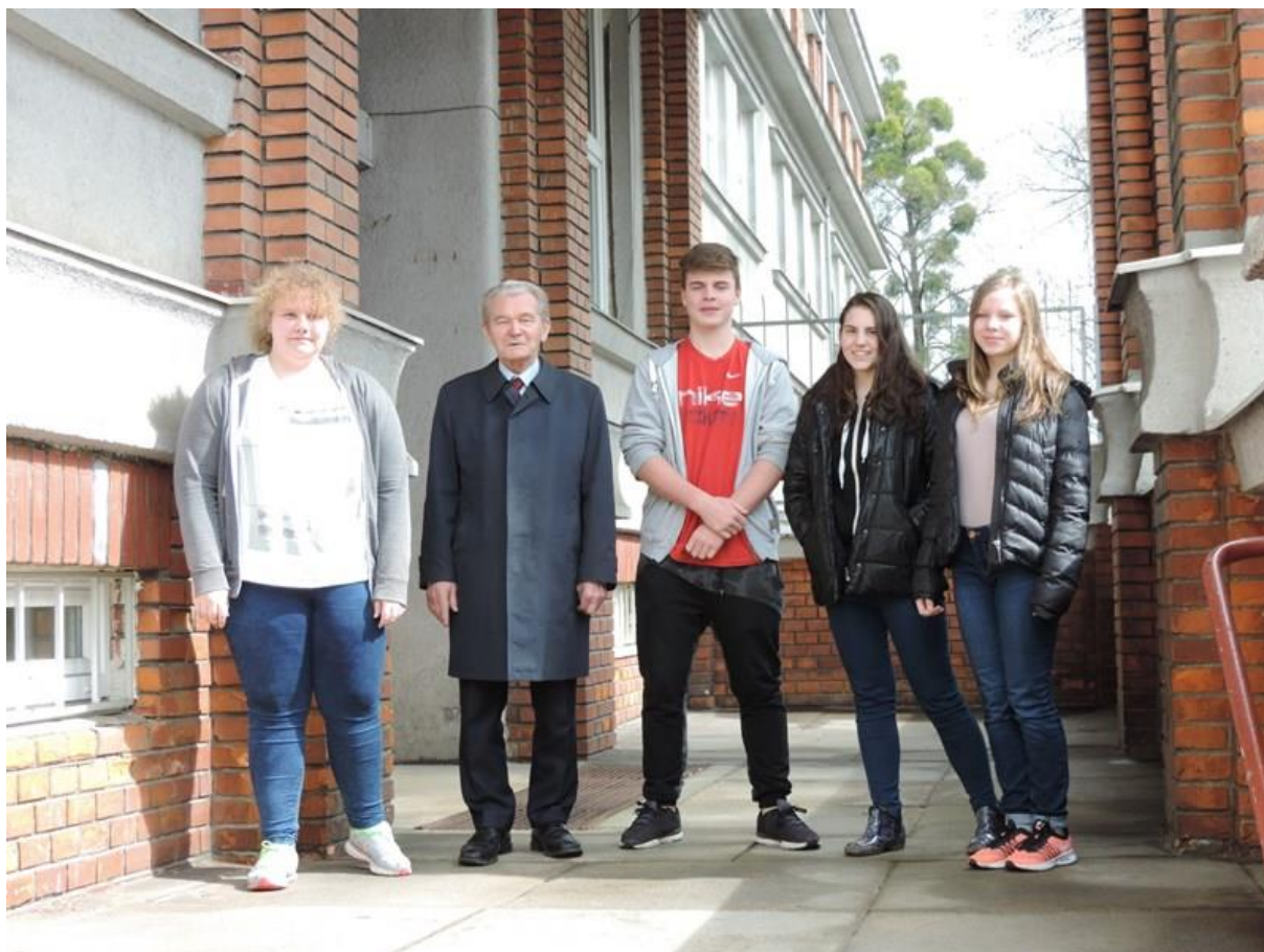
Gymnázium Nový Jičín – zde nebyl pan Žídek připuštěn k maturitě