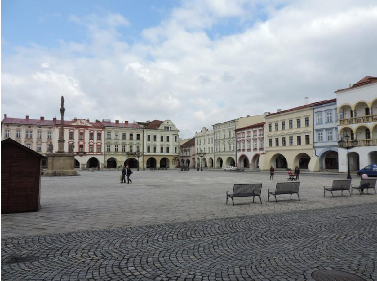
Nový Jičín - náměstí