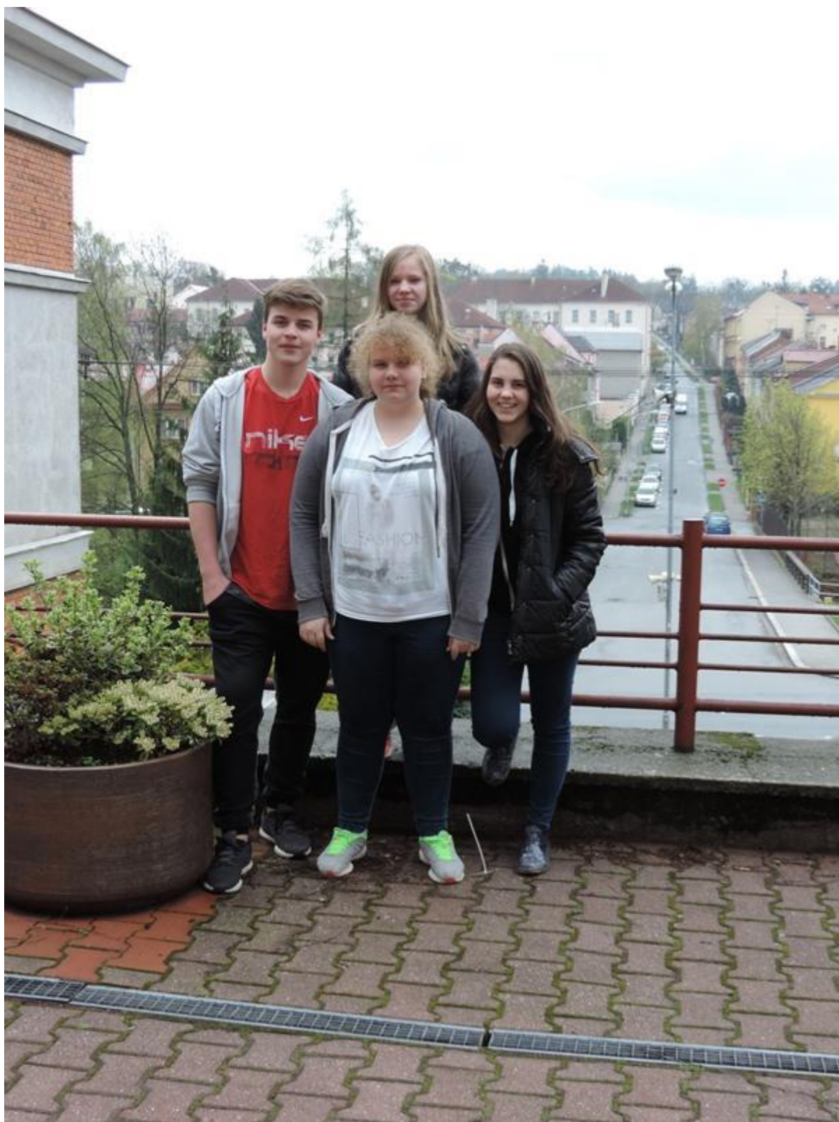
Žákovský tým u gymnázia Nový Jičín