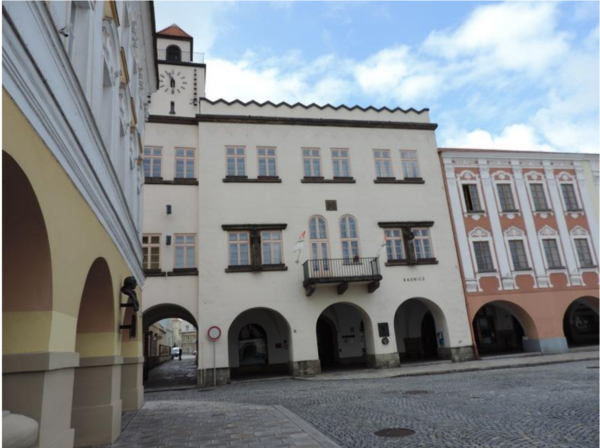
Nový Jičín – budova radnice