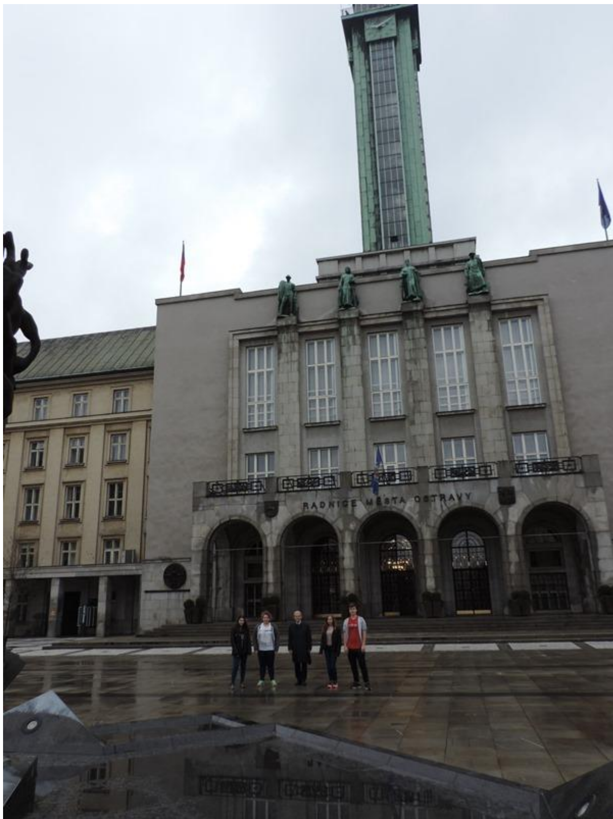
Fotografie s panem Žídkem