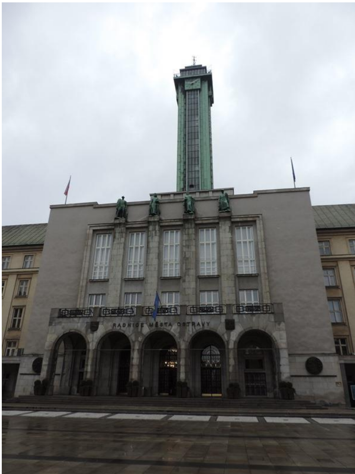
Radnice města Ostravy