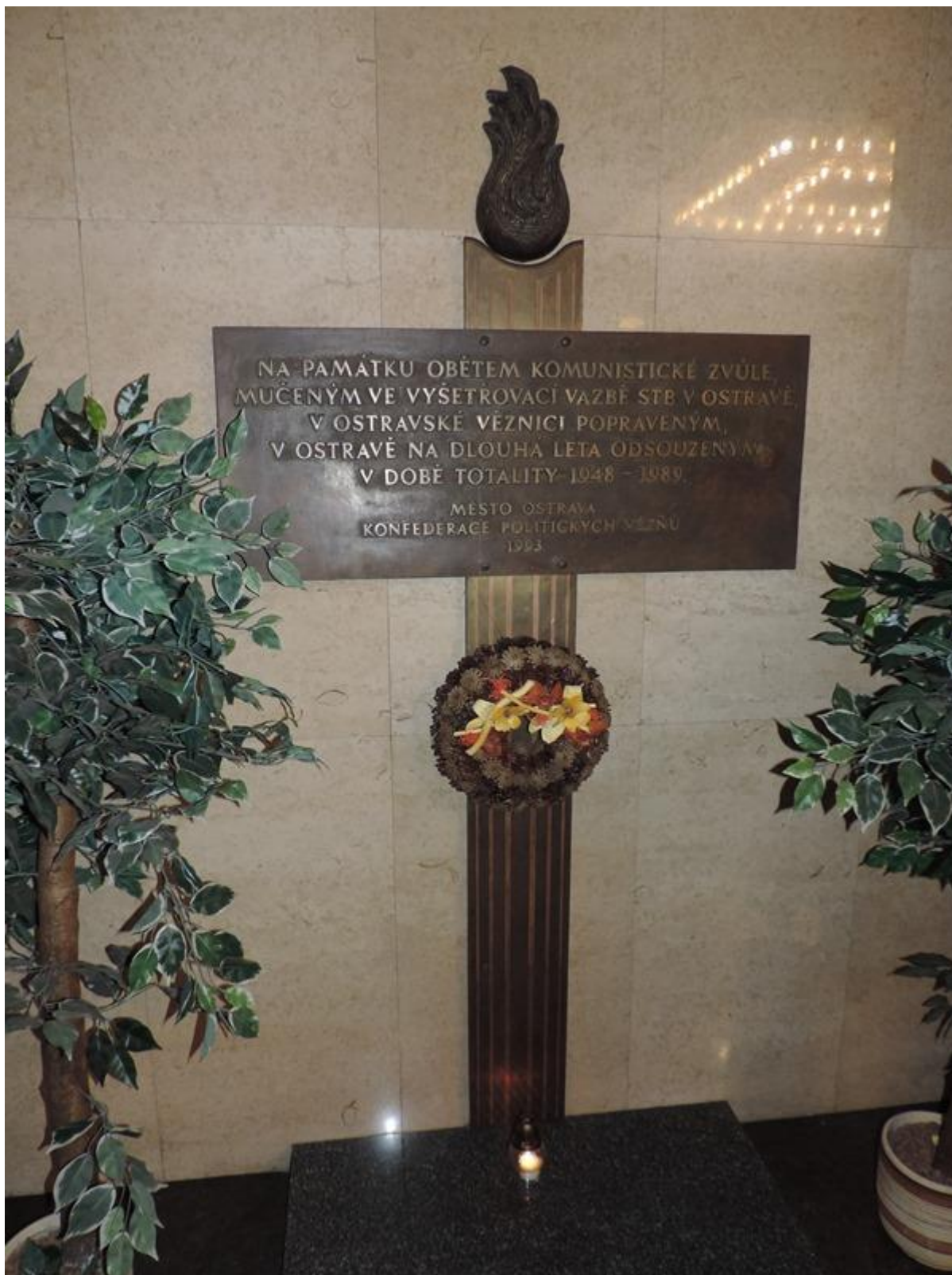
Památník obětem komunistické zvěle v budově radnice města Ostravy