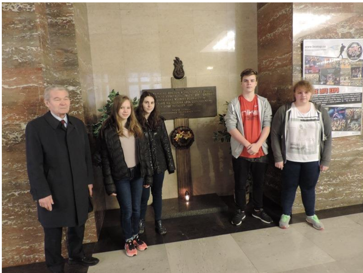
Zapálení svíčky u památníku obětem komunistické zvěle