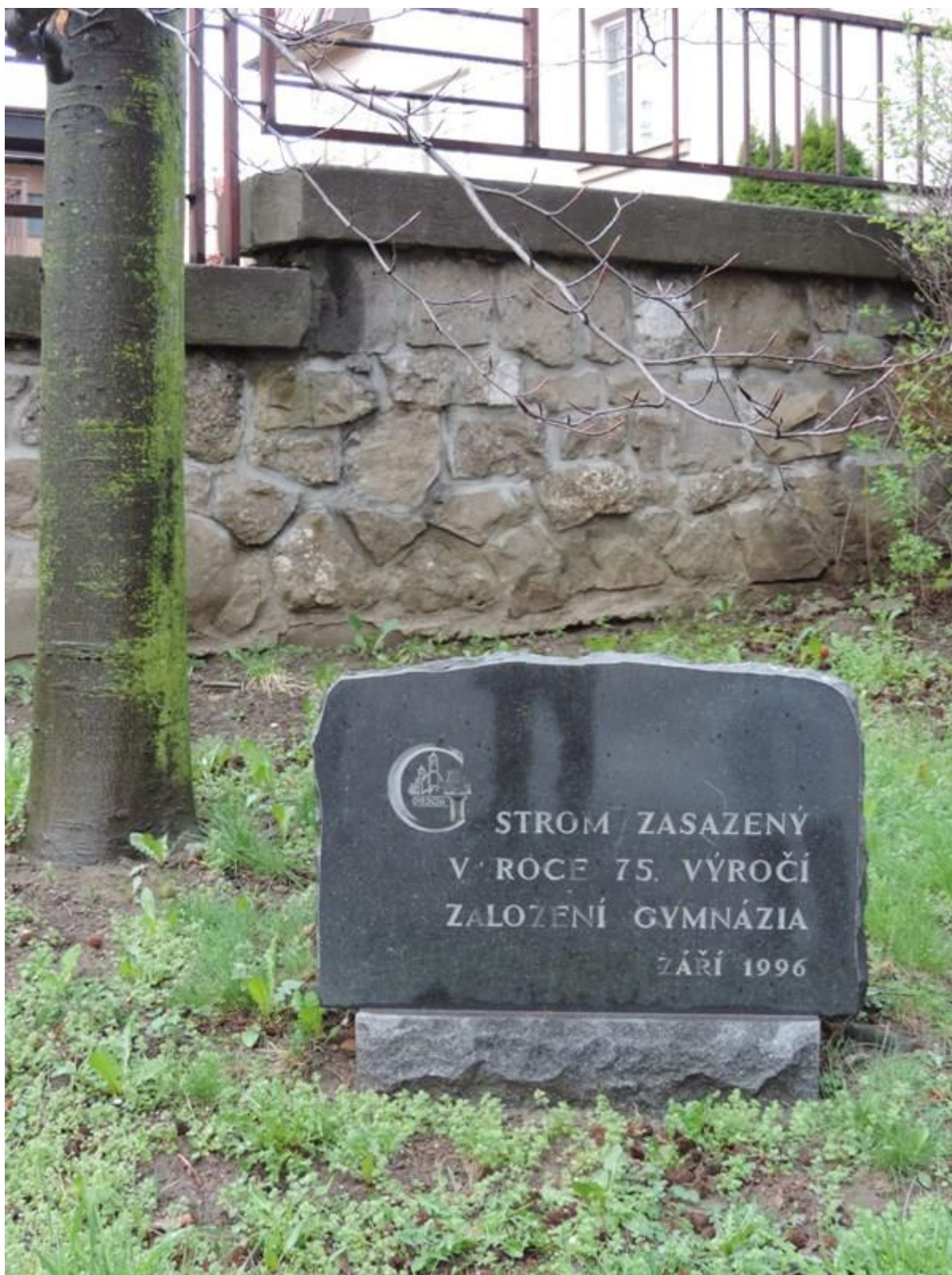
Gymnázium Nový Jičín – školní zahrada