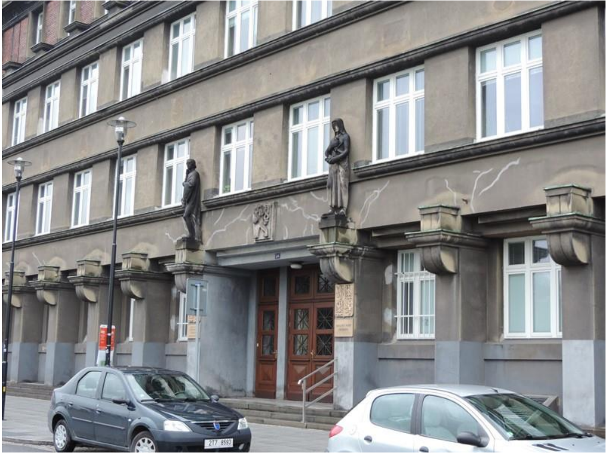
Budova Krajského soudu Ostrava