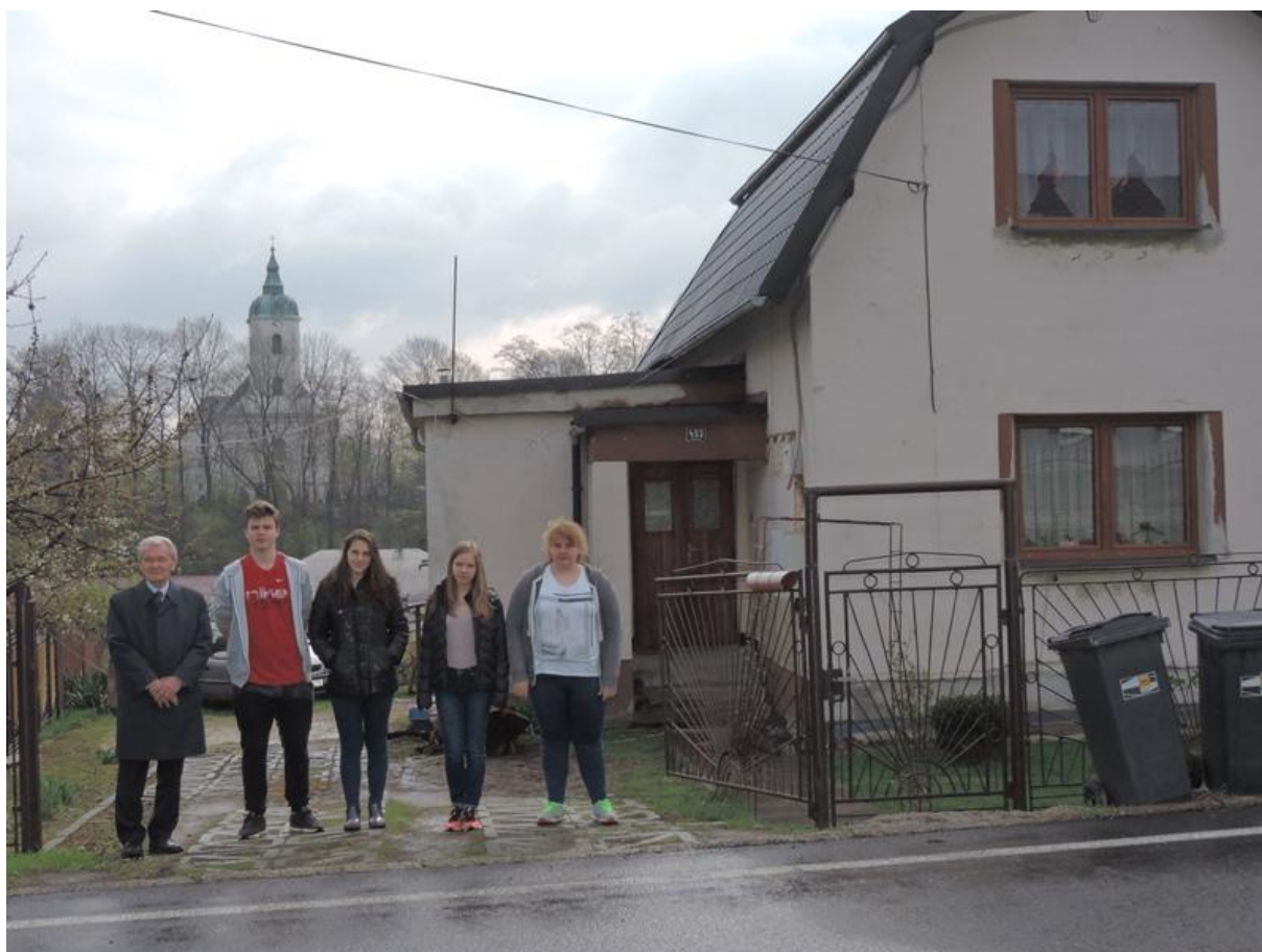
Dolní Lutyně – rodný dům, v pozadí kostel, kde byl pan Židek pokřtěn