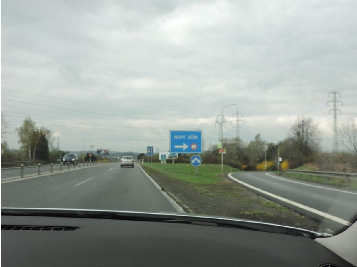
Cesta do Nového Jičína