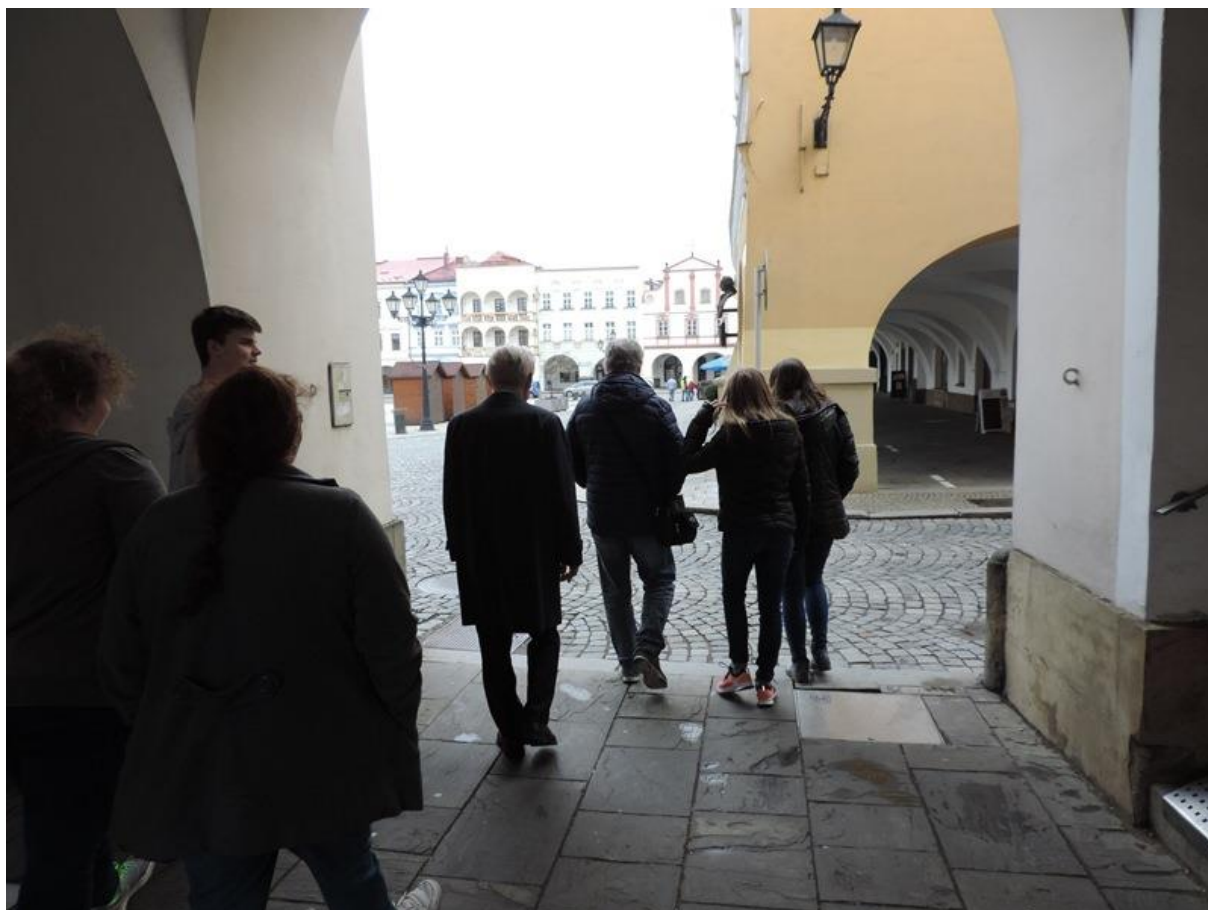
Nový Jičín – procházka na náměstí