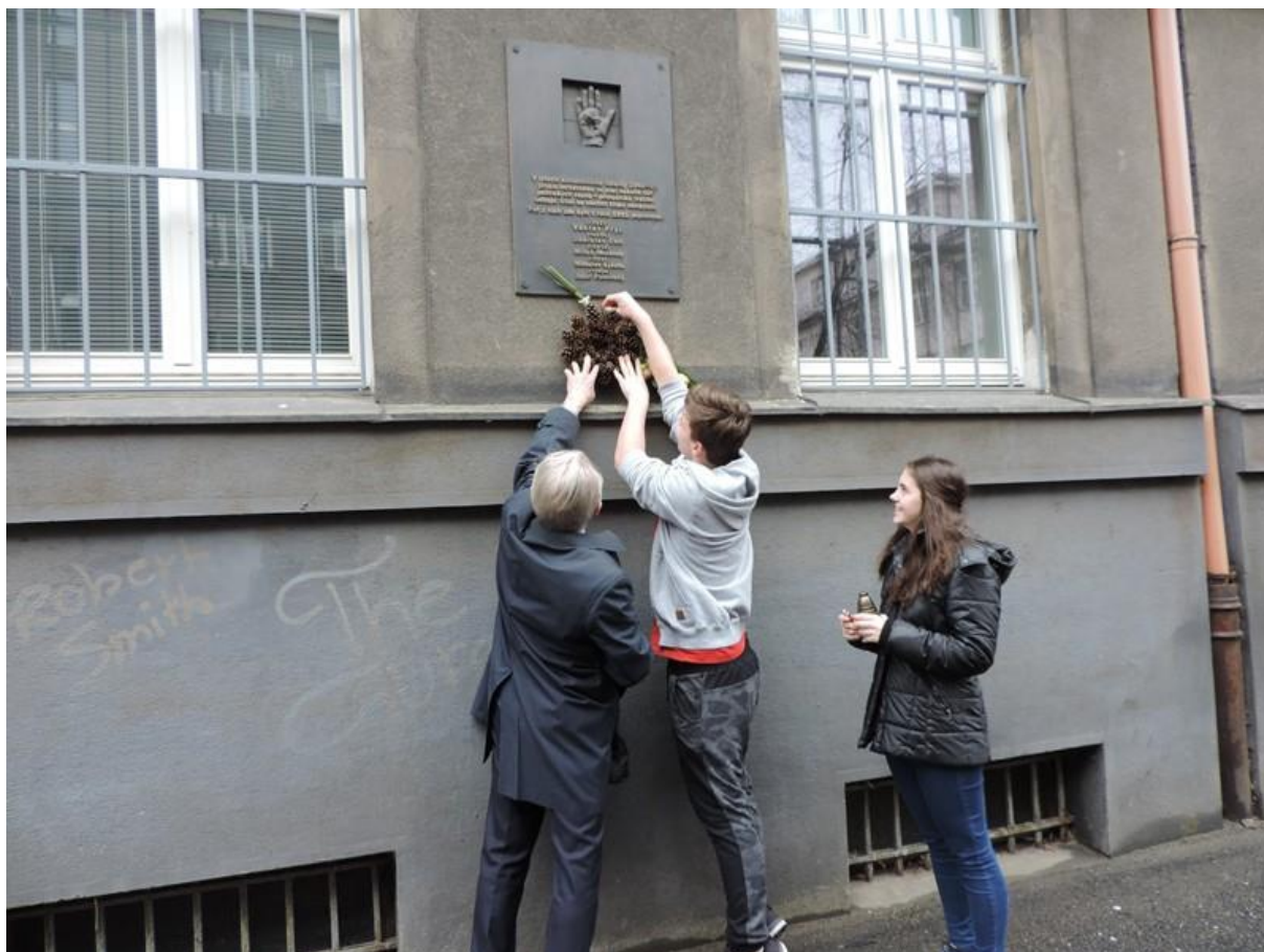
Položení květiny u pamětní desky na budově vazební věznice Ostrava