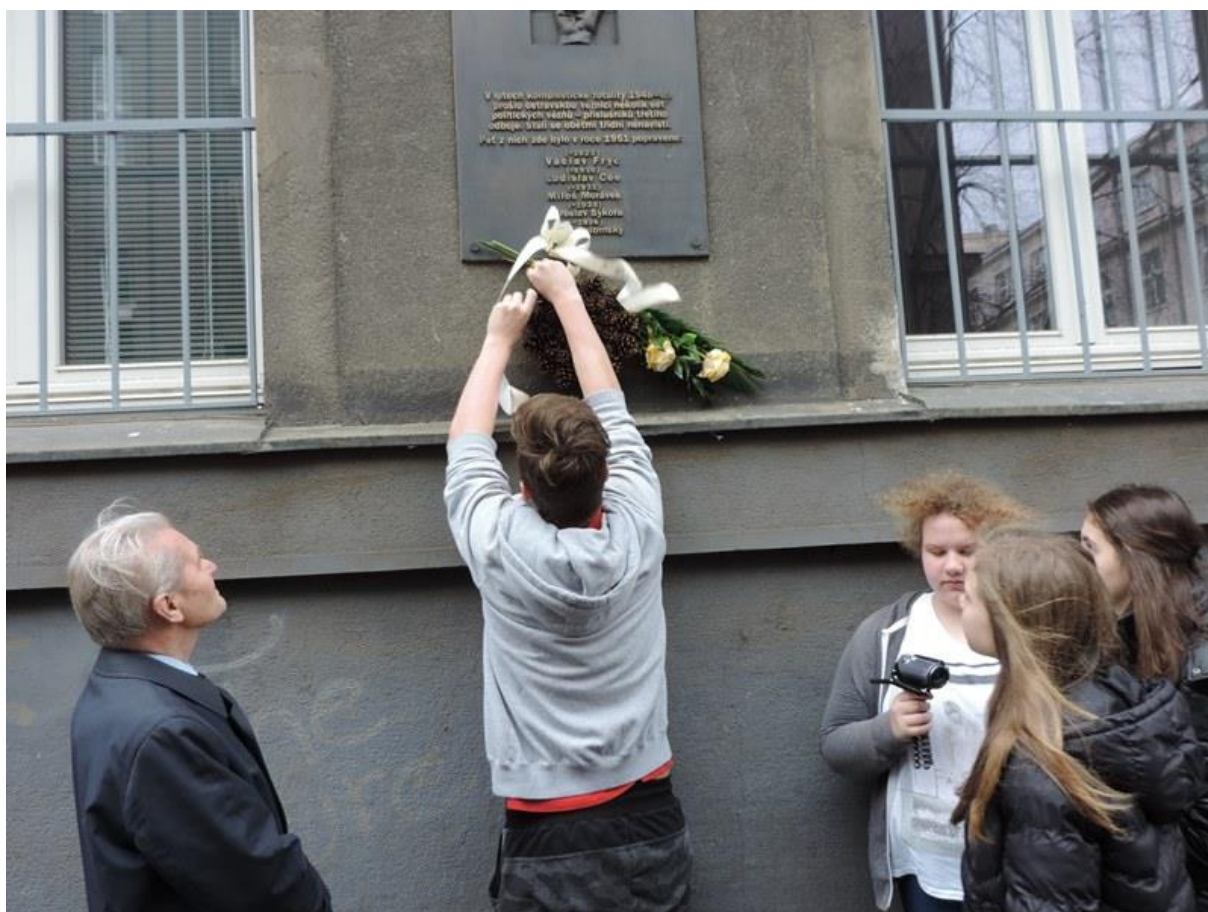
Položení květiny jako výraz úcty žáků 8. A