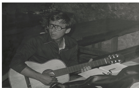
Tábor na Zvířeticích