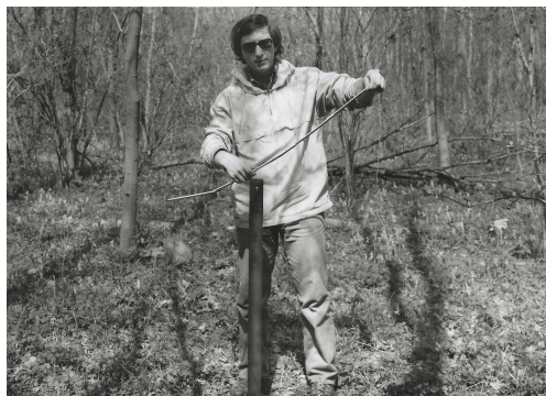
Rezervace Loužek, 1983, terénní výzkum

Na Přírodovědecké fakultě vystudoval obor botanika. O zaměstnání se začal ucházet v pravý čas. Na západ uteklo mnoho lidí z řad inteligence a díky tomu se dostal do Státního ústavu památkové péče a ochrany přírody, tehdy spadající pod resort kultury. Zde mohl propojit práci a všechny své záliby.