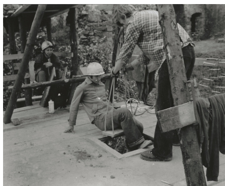
Zvířetice, tábor Brontosaura rok 1975 - dramatické čištění 70 m hluboké hradní studny