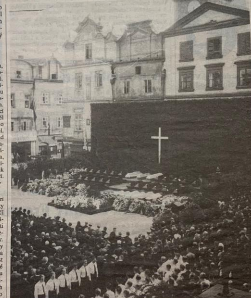
Pardubice se loučí s obětmi červencového náletu

Se svými mrtvými se Pardubice loučily v sobotu 22. července 1944. Vzpomínky na prožitý strach nabývaly v postupujícími dny na stále větší naléhavosti. Vcelku zbytečně zdejší list připomínal 18.