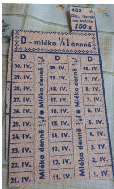
Lístky na mléko