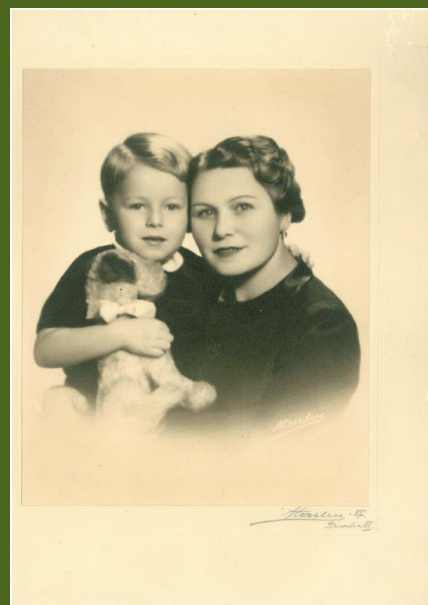
Vzpomínka na rodiče.