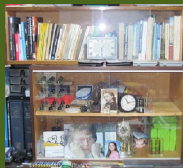
Vzpomínky na manželství.