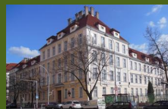
Následovala studia na gymnáziu Kodaňská v Praze, kam se vrátili na konci války.