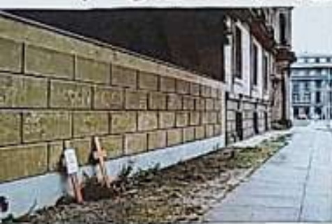
Návštěva Berlína kříže za zastřelené uprchlíky.