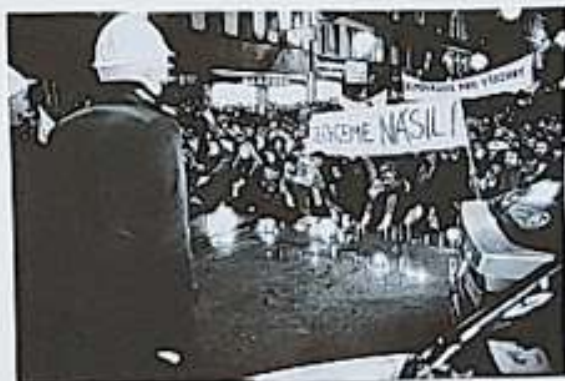
Napadení studentů policií začátek Sametové revoluce