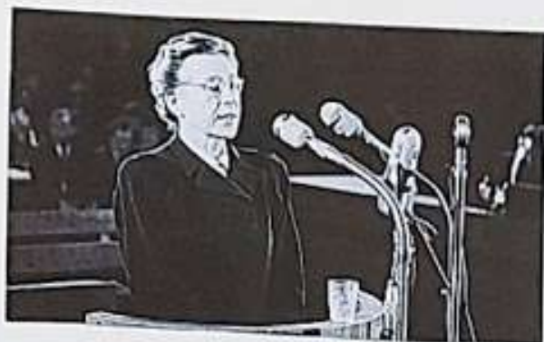
Poprava M. Horákové