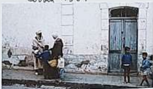
Brvní bydlíště manželů v Saide