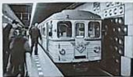
První linka metra v Praze