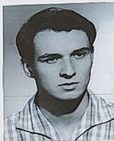
Upálení se Jana Palacha leden 1969