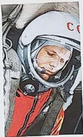
let J. Gagarina dubny 1961