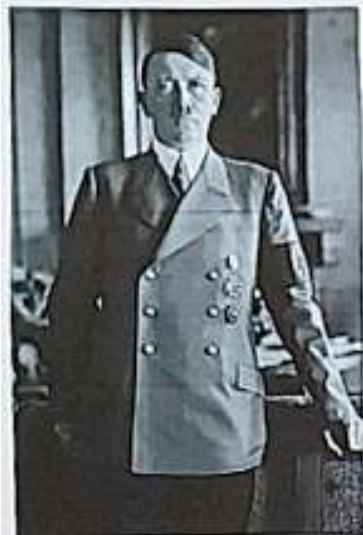
Nástup Adolfa Hitlera k moci v Německu