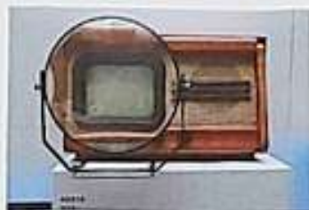
První vysílání Československé televize