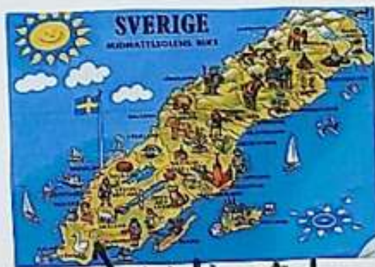
Kristianstad. Konec 70. let - stěhování na jinou zemi do Kristianstadu.