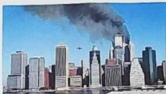
Útok na Světové obchodní centrum v New Yorku