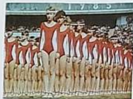
Poslední Sparta balet