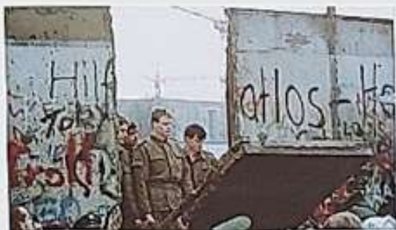
Pád berlínské zdi