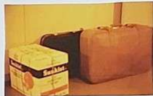
Jediný majetek manželů po emigraci do Švédska

„... Tak jsem dal ty poukázky bratřovi, s tím, že když se rozhodneme, že zůstaneme mimo, když podne definitivní rozhodnutí, že mu zavolám. Šifra „psa nepozíles.“ Tak dostal to telegraficky, tak sednul do auta a jel do živnostenské banky a tam to všechno vybral a rozdělil podle toho, jaké měl instrukce.“