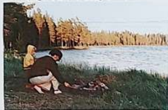
Manželka a dcera se žijí ve Švédsku