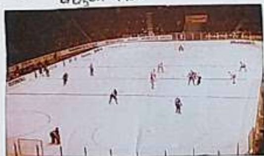
Hokejový zápas proti SSSR

"A znovu, pořád to opakují, to přijeli ve Švédsku bylo skvělé, velmi přátelské. Všude porozumění, chápání věci. V nejmenším bych si na ně nemohl stěžovat."