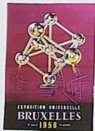
Účast Československa na světové výstavě v Bruselu