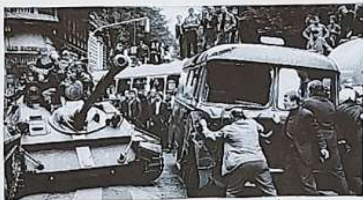
Vojska Varšavské smlouvy v Praze