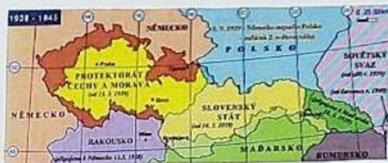
Protektorát Čechy a Morava