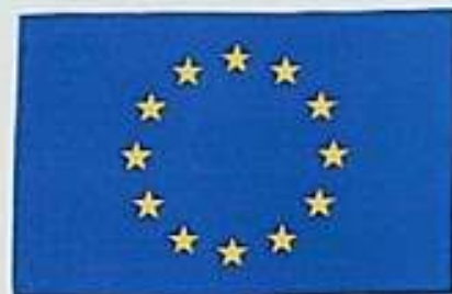
Vstup ČR do EU