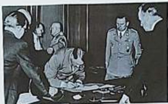
Podpis mnichovské dohody