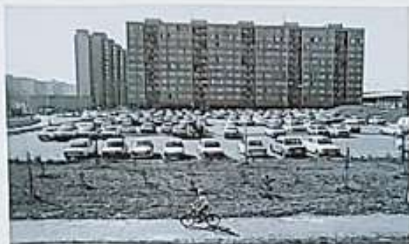
Výstavba panelových domů