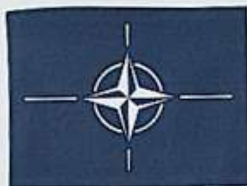
Vstup ČR do NATO