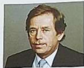
V. Havel prezidentem