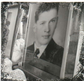
Manžel a rodiče paní Vodičkové