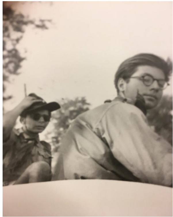
členové skautského oddílu