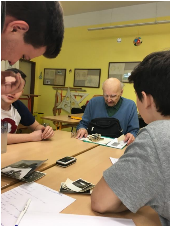
p. Práger – 9.5.2017