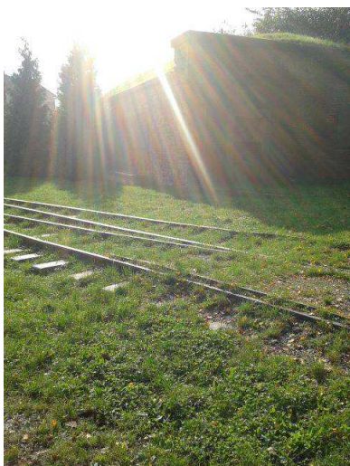
Koleje, po kterých se jezdilo na smrt... (Terezín, říjen 2014)