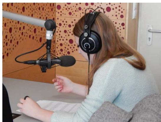
Natáčeli jsme ve studiu Českého rozhlasu (únor 2015)