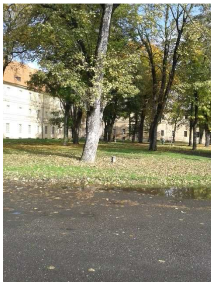
Hamburská kasárna, odkud byly vypravovány transporty na východ.

Ti, co se vrátili po válce, většinou měli štěstí, protože přežili v Terezíně, i když podmínky tam byly zvláště pro staré lidi velmi kruté, poněvadž stravy byl nedostatek. V rodinném domě, kde žili dříve 2 – 4 lidi, jich třeba bylo 30, v kasárnách bylo ubytovaných 1000 lidí, nebo 3000.