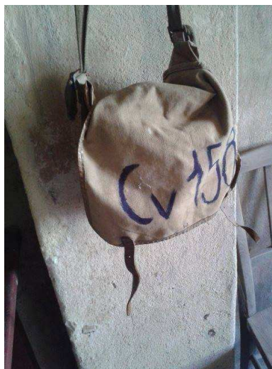
Příruční zavazadlo jednoho z terezínských vězňů