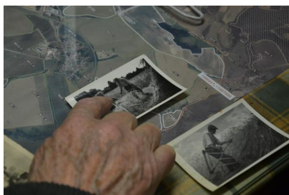
(Prohlížení fotografií na statku v dílně)