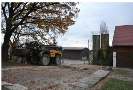
(Statek na Všebořsku)