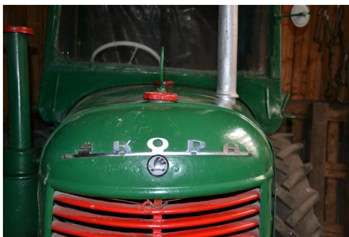
(Fotografie traktoru z naší návštěvy na Všeborsku.)

„Je to Škoda 30,“ oznámil s úsměvem pan Žáček.