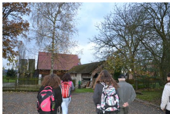
(Příchod na statek syna pana Žáčka)