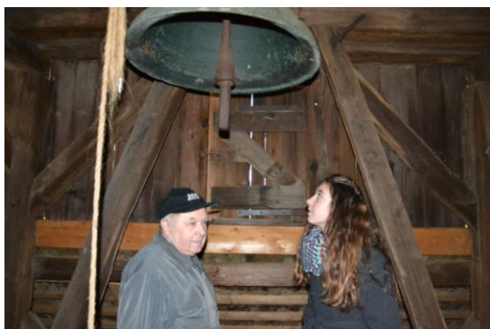
(Návštěva zvonice na Všebořsku)