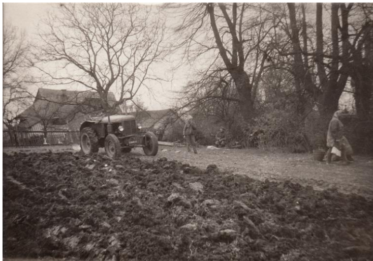
(Fotografie orby na Všebořsku.)