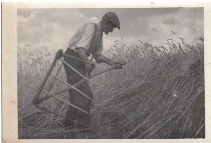
(Obruby na Pískách – sekání žita)

V současnosti hospodaří na Všeborsku čtvrtá generace rodu Žáčků.