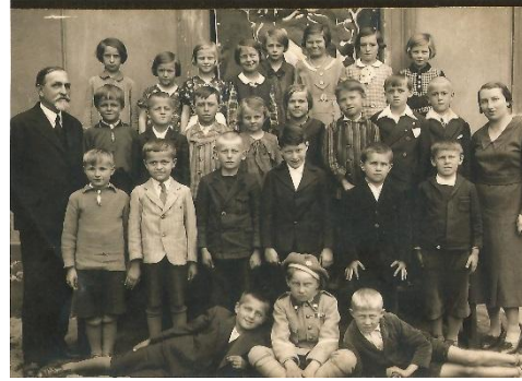
Společné foto ze školy v Mlázovicích.

Když jsme teda byli ve škole v tom Liběchově, tam byla nová škola doktora Beneše, prezidenta, tak jsme prostě chodili v září normálně do školy. Jednou jsme přišli ani ne do školy, ale na to náměstíčko v Liběchově a řekli nám, ať do školy nechodíme, že to tady bude zabráno německou armádou.