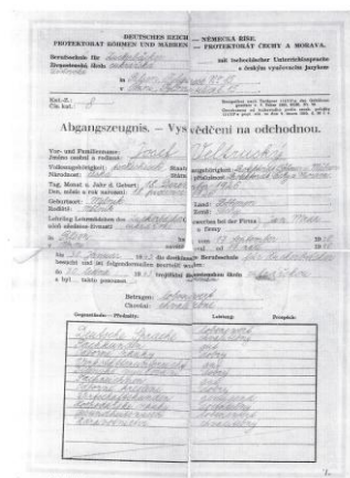
Vysvědčení z vyučení