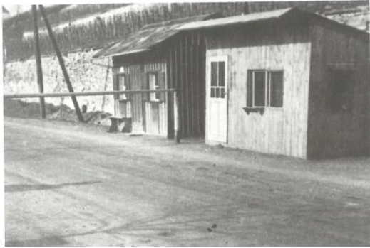
Hraniční kámen u Liběchova