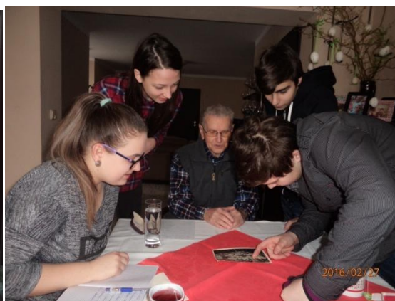
Povídání nad fotografiemi