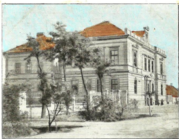
Škola v Mlázovicích

Když jsme teda byli ve škole v tom Liběchově, tam byla nová škola doktora Beneše, prezidenta, tak jsme prostě chodili v září normálně do školy. Jednou jsme přišli ani ne do školy, ale na to náměstíčko v Liběchově a řekli nám, ať do školy nechodíme, že to tady bude zabráno německou armádou.