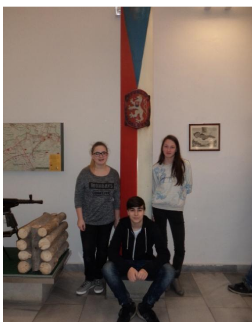
Exkurze do Muzea České policie v Praze