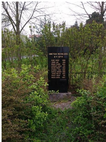
Památník ve Vehlovicích

Přišel takový rozkaz, že se budou odsunovat Němci na hranice a prostě se uzákonilo, že všichni Němci, co tu jsou, se budou odsunovat na hranice do Německa. My jsme tedy byli nejdřív v Kamenickém Šenově. Nejdřív jsme chodili po barákách, budili Němce, aby si sbalili 30 kg na osobu a za hodinu, aby byli na náměstíčku v Kamenickém Šenově, že budou odsunuti. Tam byly připraveny dva žebřináky. Tam jsme si vyslechli nadávky, německy samosebou. Asi to byly nadávky. My jsme toho moc německy neuměli. Bylo to takový dost drastický. Nedalo se nic dělat. Byli jsme vojáci a museli jsme poslechnout rozkaz. Ono by to jinak nedopadlo, Ti Češi, co museli před šesti lety odtamtud utíkat, nechali tam všechno jmění, tam, co to Němci zabírali, si taky zkusili svoje. Naložili jsme je na žebřináky a šli jsme s nimi až na hranice, tam jsme je vyložili a nechali jsme je tam. To už byla jejich věc, to už se museli postarat oni sami. Nebo Němci.