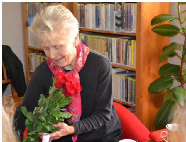
(Fotografie pořízené při natáčení rozhovoru v Dolním Bousově)