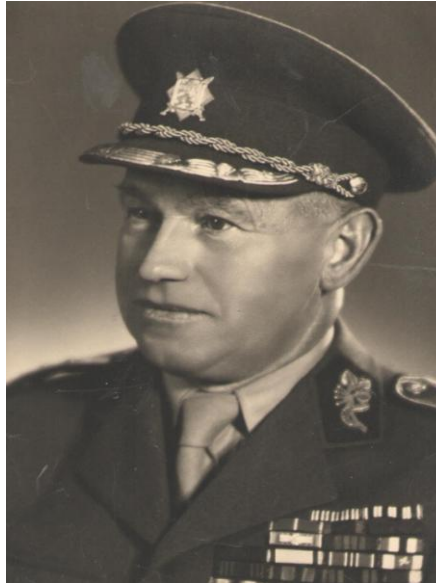
Foto: generál Alois Liška