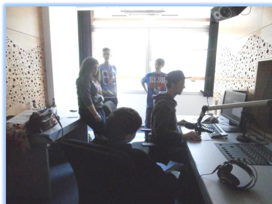
(Ve studiu českého rozhlasu)