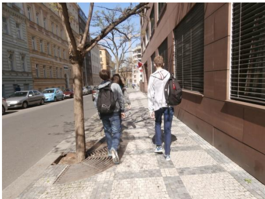
(Na cestě do studia)