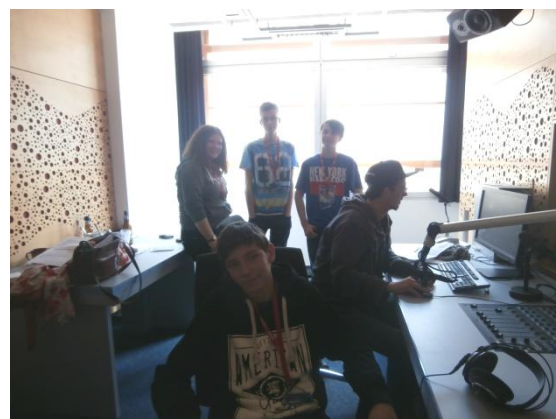
(Ve studiu českého rozhlasu)