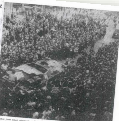
Fotografie z jednání NS

PRÁHA (ČTK) - Na mimolidské schůzi v Praze schválilo předsednictvo Národního shromáždění (NS) v úterý 22. srpna 1968 v úvodu svého jednání prohlášení, kterým se zavázalo k tomu, aby se v budoucnu vyvíjelo a rozvíjelo v rámci socialistického státního zřízení v souladu s ústavními zásadami socialistického státního zřízení. Provozní Národní shromáždění se v úvodu svého jednání vyjádřilo k tomu, že je připraveno k tomu, aby se v budoucnu vyvíjelo a rozvíjelo v rámci socialistického státního zřízení v souladu s ústavními zásadami socialistického státního zřízení.