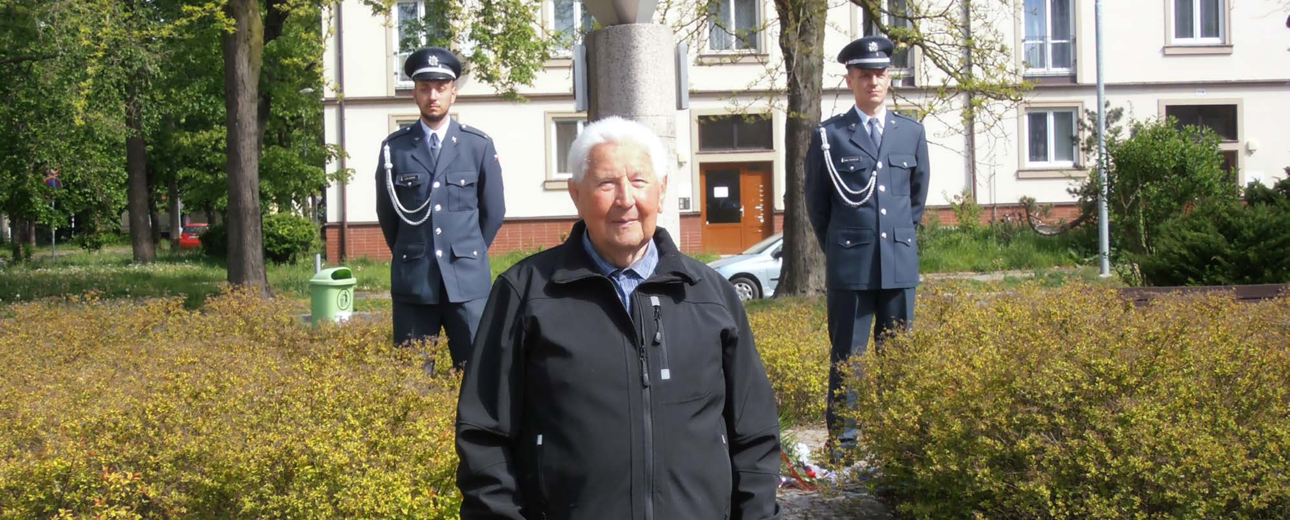
Pomník československým letcům a parašutistům 2. světové války