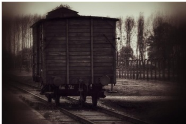
Vagon pro přepravu dobytka

Ve dvě hodiny ráno nastala výměna stráží. Podstatští věděli, že kdyby přišel přísný strážník, pošle je zpět a rodiče půjdou rovnou do vězení a do uranových dolů. Ale pomohl jim snad duch svatý, protože zrovna měl směnu, kde vedoucí strážník byl z Telče. Ten když zaslechl jméno Podstatzký a zjistil, že pocházejí od Telče, kde je všichni znali, uvědomil si, co by se jim mohlo stát a tajně je odvedl k vagónu pro dobytek, kam je nechal nastoupit.