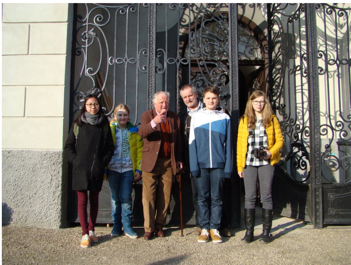
Náš tým při návštěvě zámku 13. 3. 2017