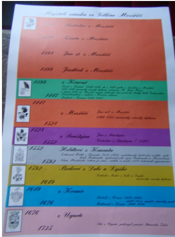
Historie rodů ze zámku ve Velkém Meziříčí