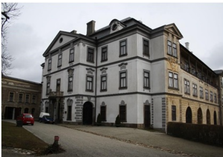
Zámek ve Velkém Meziříčí

Po roce stráveném v Itálii se rodiče rozhodli, že se vypraví do Chile. Janovi bylo téměř 12 let.