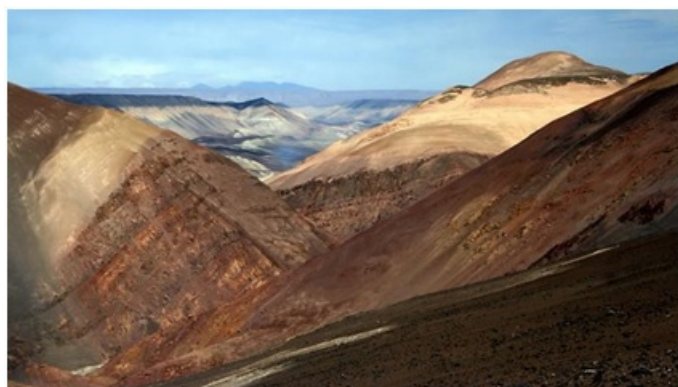
Krajina v CHile