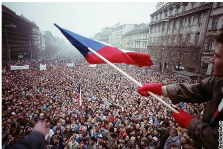
Václavské náměstí Praha 1989

Jan vlastnil ve Španělsku stavební firmu, prodal tedy pár domů a za vydělané peníze chtěl odkoupit zpět svůj zámek. Lidé po revoluci byli vstřícní a zámek se mu podařilo získat zpět díky restituci.