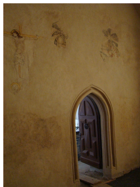
Vstup do restaurované kaple sv. Markéty na zámku ve Velkém Meziříčí