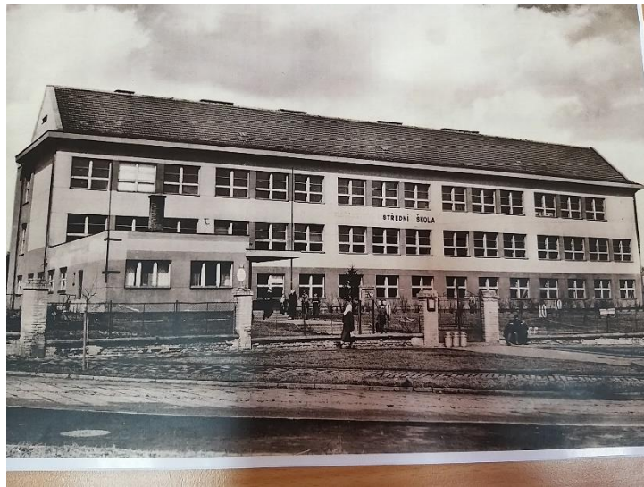
Fotografie před naší školou