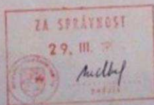
Zpráva o sledování

Uplatněním sprav. a preventivních opatření v rámci "pokládání věnodů" v Zpč. kraji pracovníky ZÚ USA dne 19. a 20.5.1984 nedošlo ze strany příslušců a sign. CH-77 a UH k zneulití této návštěvy k vyvolání protisocialistických nálad a výtržností (DRUŽKA, TOPIČ). Objekt akce DRUŽKA (Silvestra LUFERTOVÁ) se prováděla za objekta akce PAKKA (CHNÁPKO - zájmová osoba S-StB Ústí n./Labem) a dle agt poznatků hodlají v letních měsících ve své hosp. usedlosti uskutečnit setkání sign. CH-77 z řad mládeže. Při zjištění konkrétního termínu bude provedena bosp. akce k zamezení setkání.