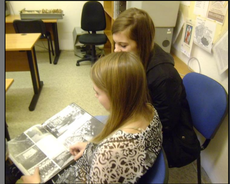
Sběr dat v oblastním archivu