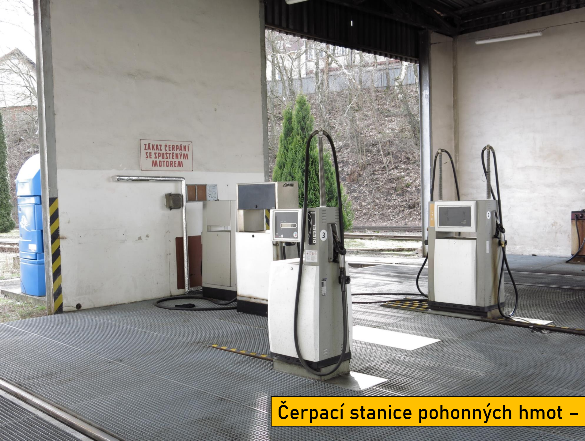
Čerpací stanice pohonných hmot – nafty, LT0 a AddBlue