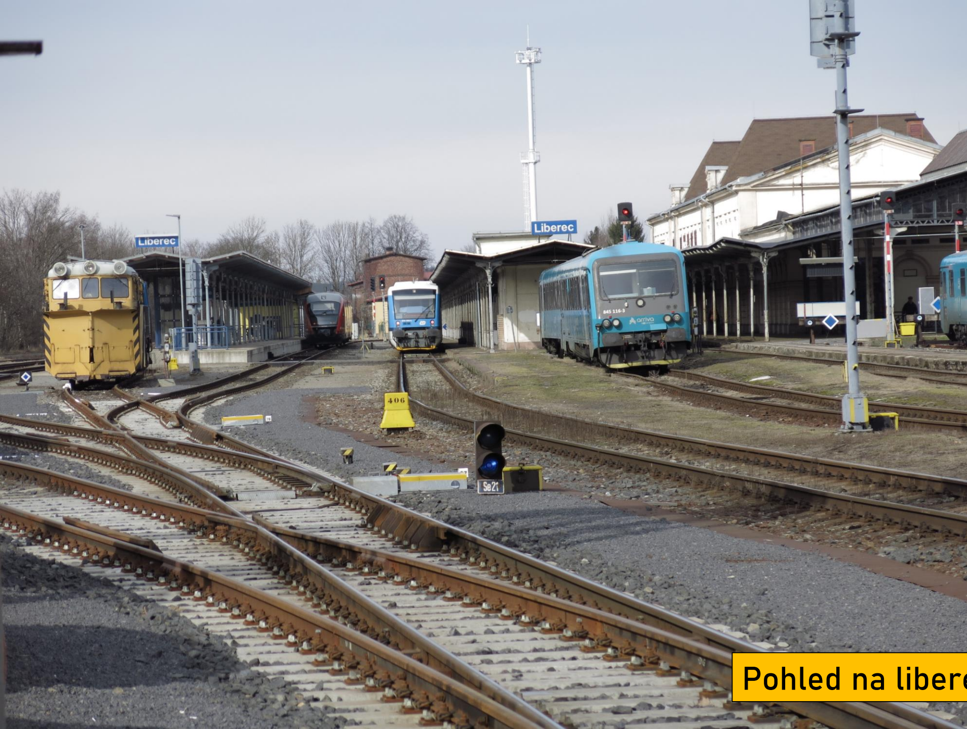
Pohled na liberecké nádraží od depa