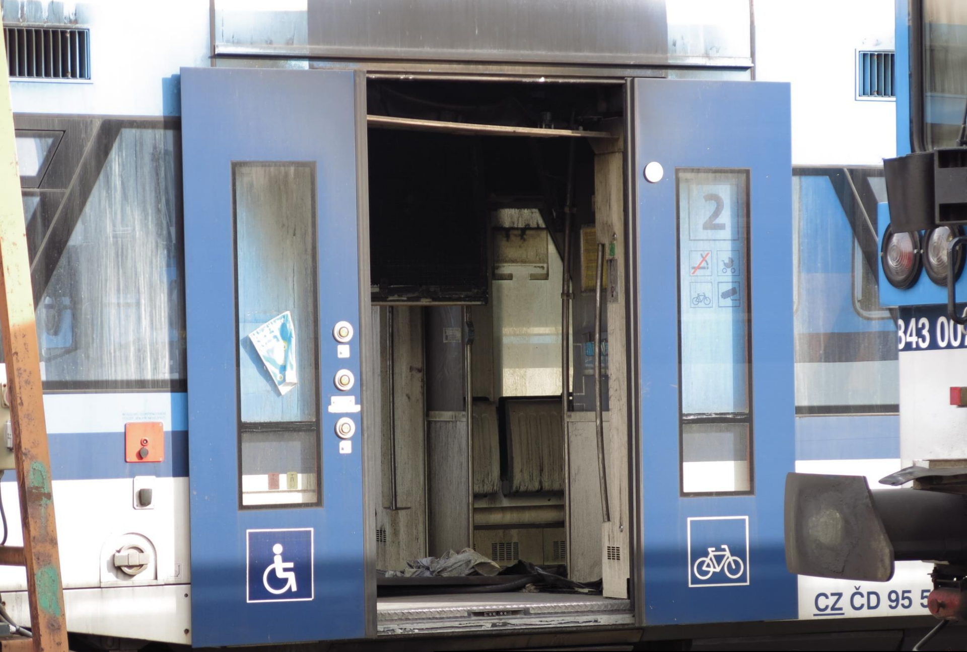
Tato souprava zahořela při jízdě z Polska do Harrachova