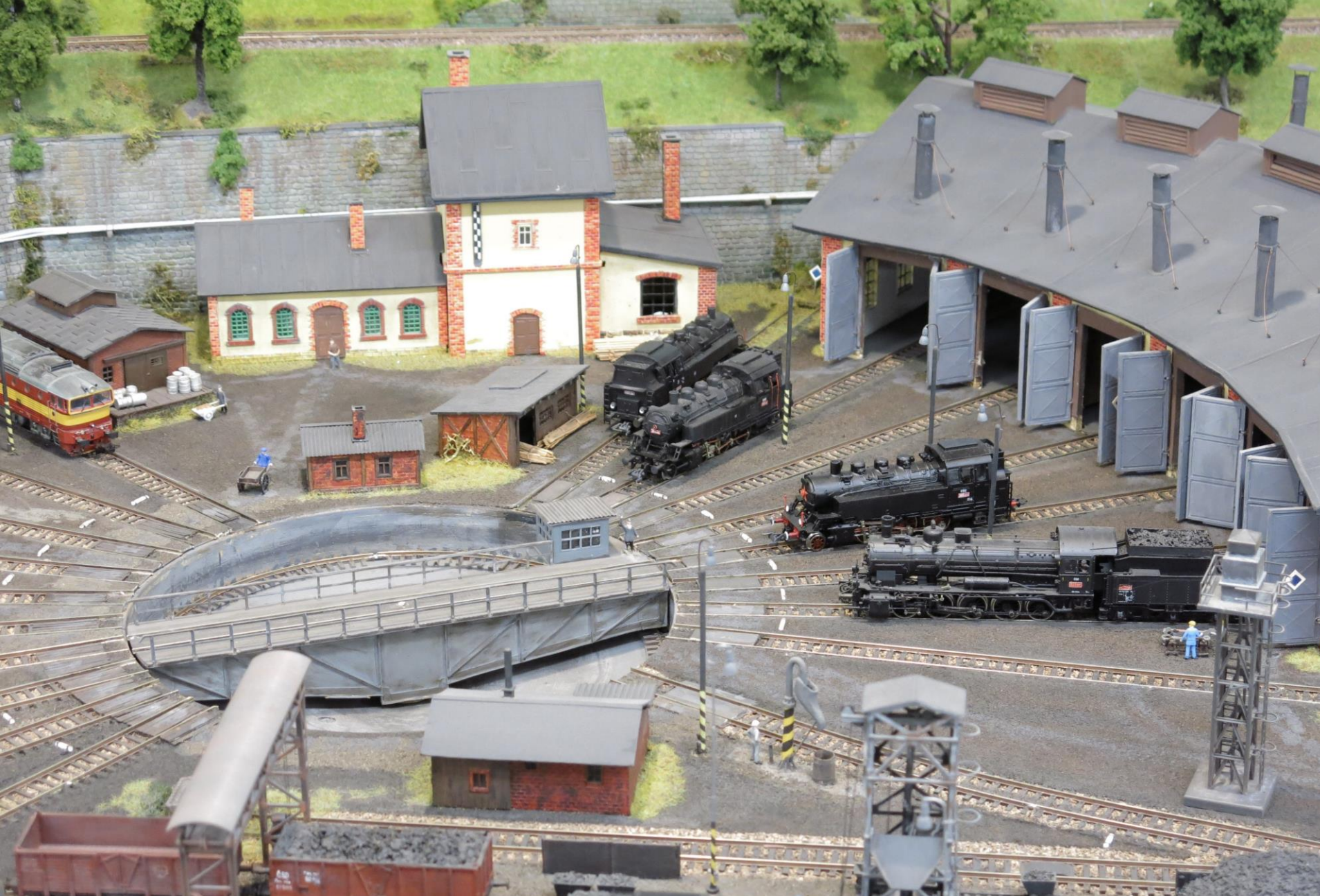
Utajený klenot libereckého nádraží – modelová železnice místních nadšenců