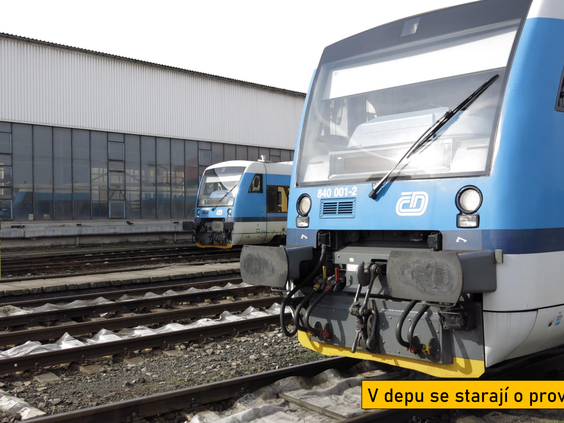
V depu se starají o provoz osobních vlaků, ...