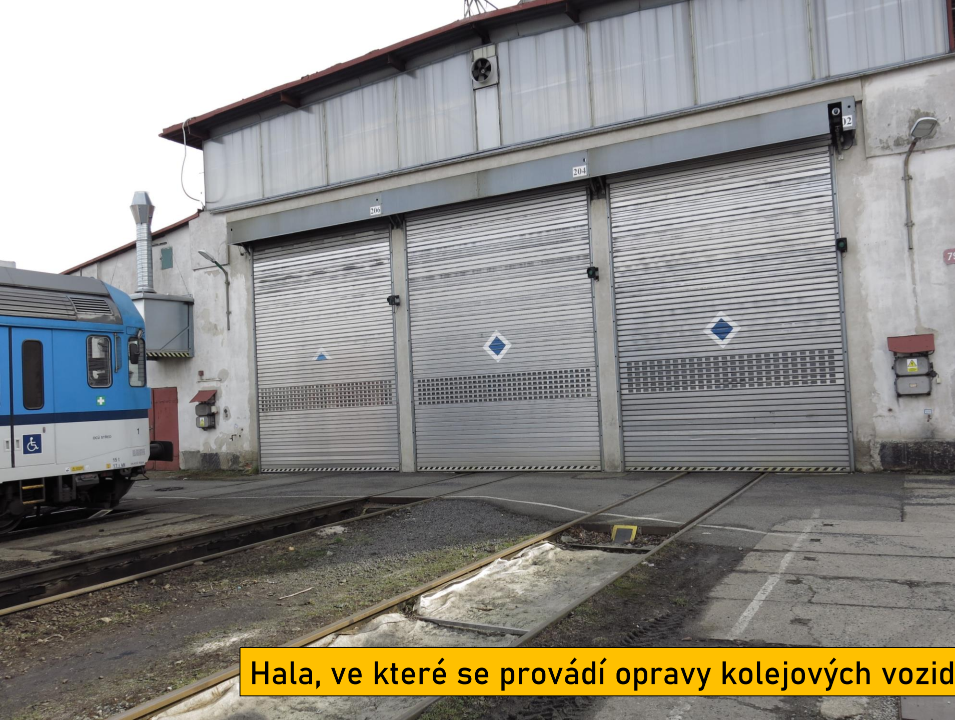
Hala, ve které se provádí opravy kolejových vozidel – pohled zvenku ...