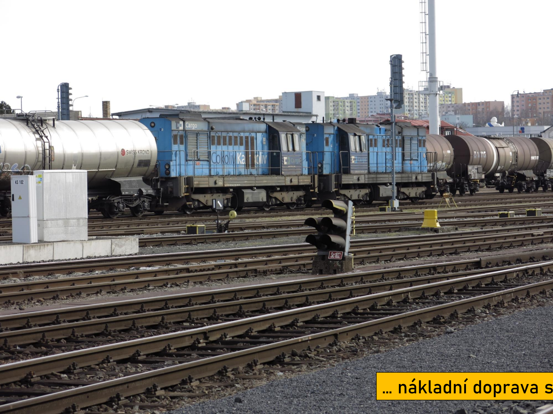
... nákladní doprava spadá pod ČD Cargo