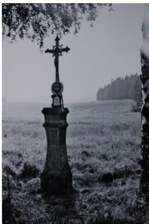
Hranice u Chebu

Už nástup komunismu v roce 1948 jeho rodinu dosti zasáhl, protože jeho tatínek pracoval jako živnostník a ani jeden z jeho rodičů nikdy nevstoupil do strany.