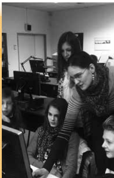
Děti v Archivu bezpečnostních složek