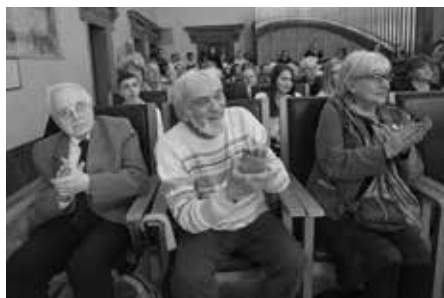
Pamětníci na závěrečné prezentaci v Plzni