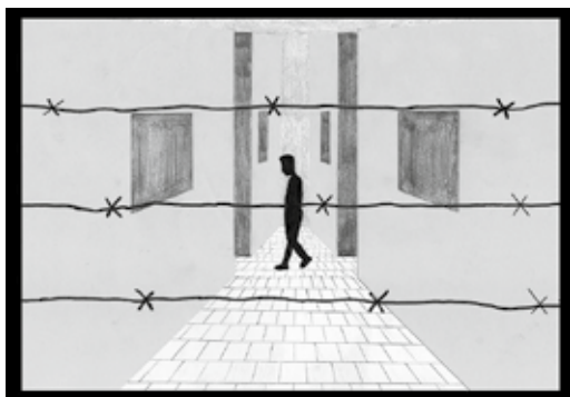
Ilustrace k příběhu P. Wenera od K. Hnětkovské