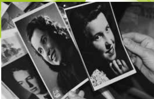
Prohlížení dobových fotografií