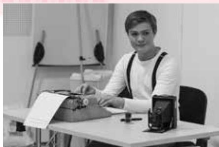
Dramatické ztvárnění příběhu