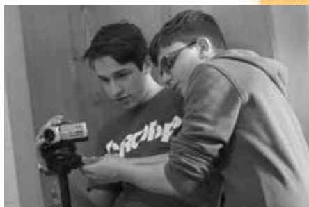
Práce s technikou