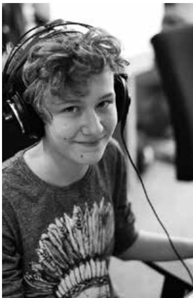
Natáčení reportáže v Českém rozhlase