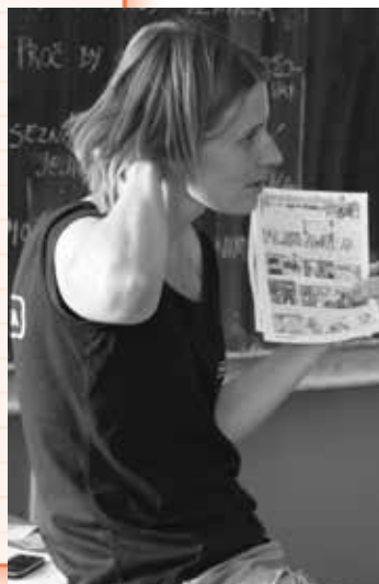
Koordinátorka projektu ve škole