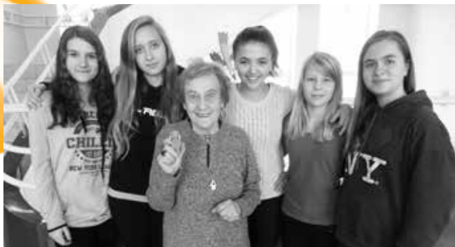
Žákoucký tým z Prahy 6 s pamětnicí