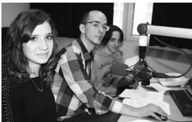
Audioworkshop v Českém rozhlase