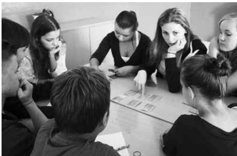
Diskuze nad lidskými právy