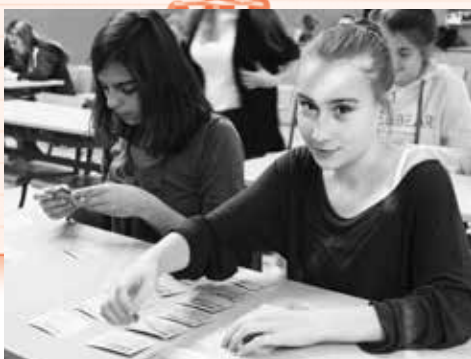
Workshop Lidská práva – Chraňme je!